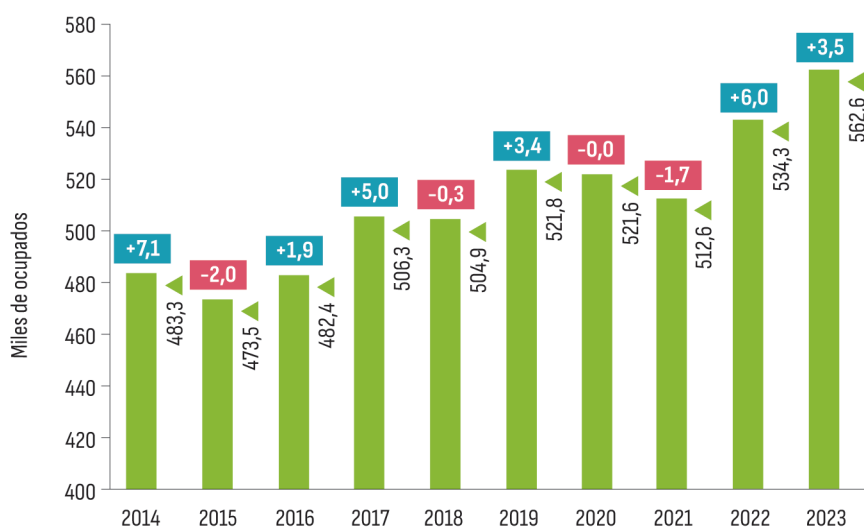
GRÁFICO 2.4.2. Ocupados en la industria de alimentos, bebidas y tabaco. Evolución 2014-2023. Miles de personas y variación (%) interanual.