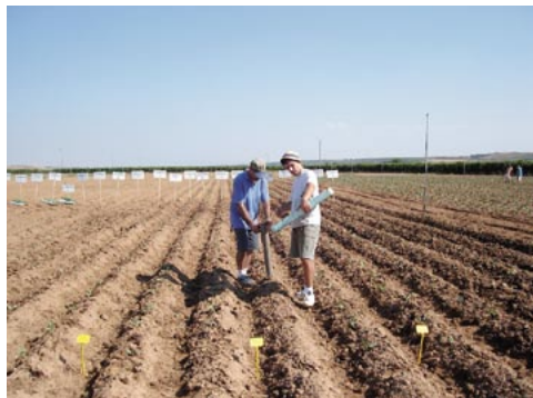
Foto 2. Vista de las parcelas experimentales de coliflor