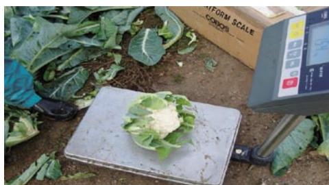
Foto 3. Detalle de la medida del peso de una inflorescencia comercial