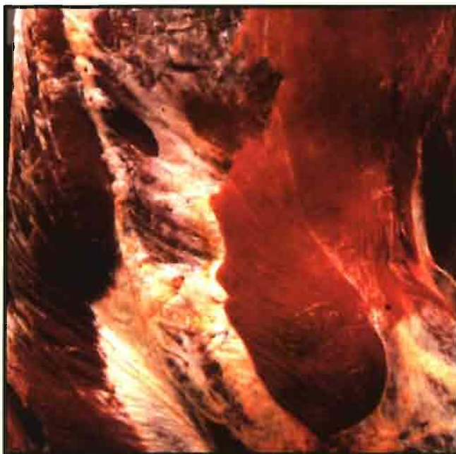
Varios factores determinan la coloración de la carne.

El estrés va a repercutir negativamente sobre el pH final (medido a las 24 h post-sacrificio), así como en la velocidad de descenso, y como se comentará más adelante, va a ser un condicionante clave en otros