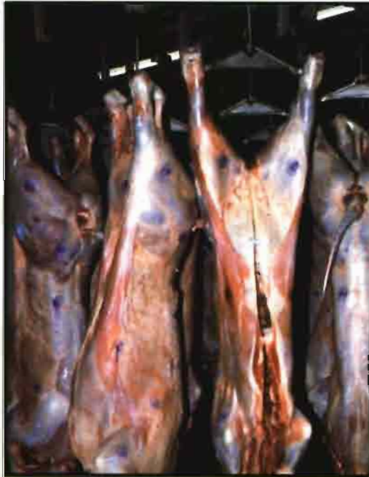
24 horas después del sacrificio la carne madura.

- El tipo de dieta: aquellas raciones que son ricas en forrajes proporcionan carne de color más oscuro, debido a los pigmentos que éstos aportan y puedan depo-