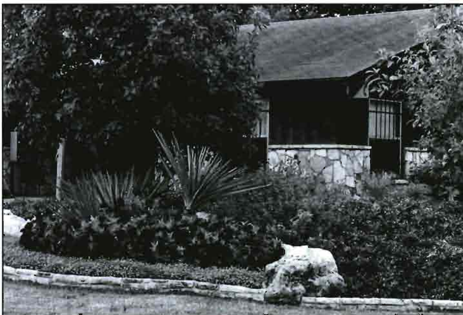
Jardín con alta densidad de especies vegetales (Foto publicada en el libro «Xerojardinería» de Silvia Burés).

L os jardines con elevada densidad de plantación suelen tener mayores pérdidas hídricas por transpiración que las zonas con baja densidad de plantación. Un jardín con árboles, arbustos y plantas tapizantes necesita más agua que un jardín similar con sólo plantas tapizantes.