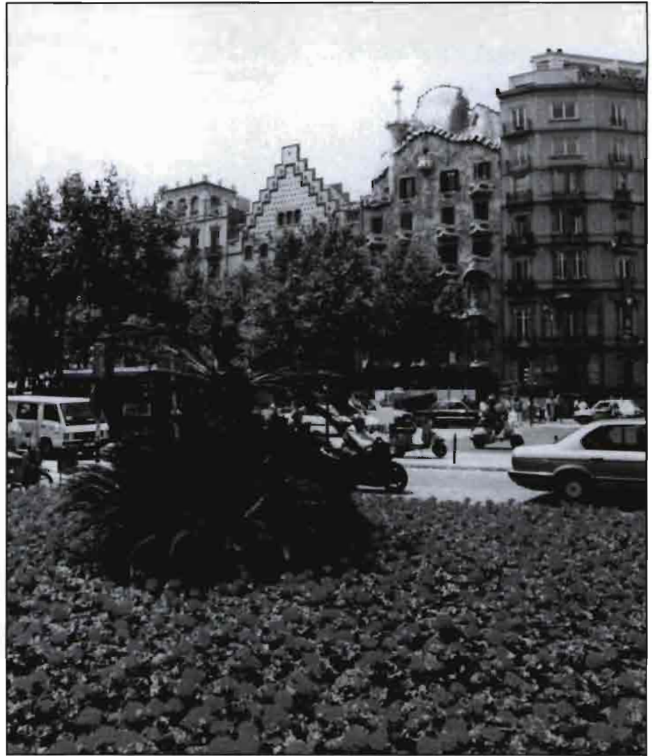
Parterre de geranios en el Passeig de Gràcia de Barcelona. Esta distribución de la planta permite optimizar el riego.

Emplea los tres factores para producir un único valor KL. KL se utiliza para aproximar las pérdidas por ET de un jardín (ETL) relativas a ETo en base a la relación ETL = KL \times ETo .