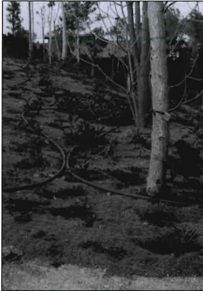
Jardín recientemente plantado. La baja densidad de vegetación hace necesario localizar el riego de cada planta.

Las plantaciones mixtas deberían tener un margen de uso de agua similar al de los árboles, arbustos y plantas tapizantes. Los márgenes presentados en el cuadro 2 (0,2 a 0,9) representan los márgenes considerados para especies individuales.