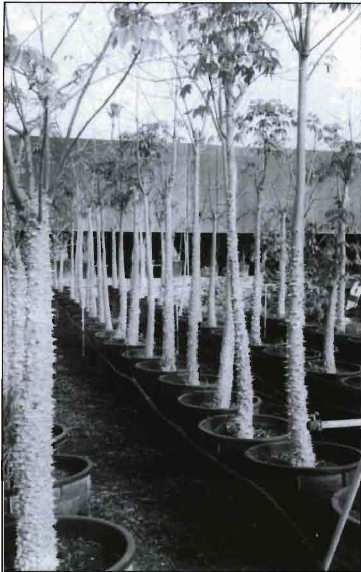
Campo de Experimentación para calcular las estimaciones hídricas de árboles ornamentales.

cuanta agua puede perderse en un jardín, KL es una estimación de cuanta agua se necesita para mantener una cierta calidad paisajística.