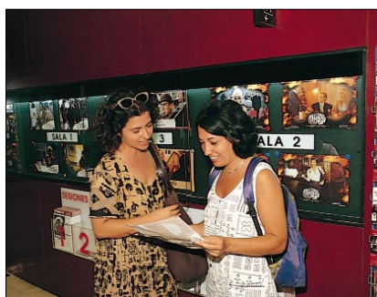
GRAFICO Nº 2