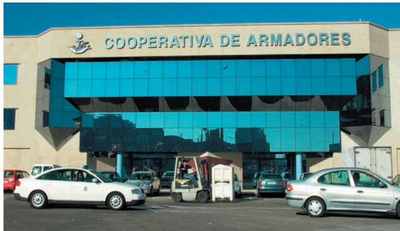
Oficinas principales de la Cooperativa de Armadores de Vigo.