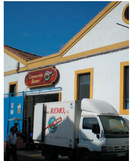
Instalaciones de Conservas Remo en Candás (Asturias)

La dirección de Conservas Remo S.L., siguiendo con la fuerte apuesta emprendida hasta ahora por modernizar sus instalaciones y modos de producción, así como por tener mayores facilidades y optar a una mejor materia prima y mayor distribución, pretende invertir en la construcción de una nueva fábrica en una parcela, recientemente adquirida en el polígono industrial de "La Peñola" en Gijón, con una superficie de 3.923.36 m 2 .