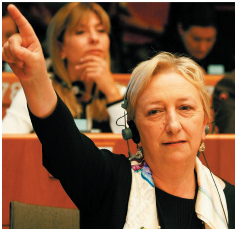
Rosa Miguélez, Eurodiputada socialista y Vicepresidenta de la Comisión de Pesca del Parlamento Europeo, en una intervención en la eurocámara.

Aunque no podemos, desafortunadamente, afirmar que ésta sea una situación circunscrita a la pesca, sí es verdad que, por una serie de razones, en los sectores primarios es todavía más evidente que en los demás sectores. Según un estudio encargado por la Comisión en el año 2002, relativo al papel de las mujeres en el sector pesquero, la proporción de mujeres en las actividades de captura es casi simbólica, un 3% del total en el conjunto de la UE. Un porcentaje mucho mayor trabajan en la acuicultura, alrededor