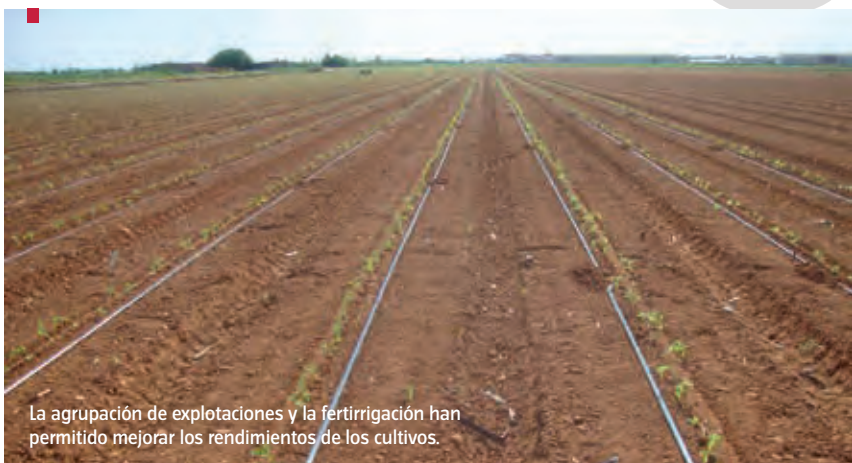
La agrupación de explotaciones y la fertirrigación han permitido mejorar los rendimientos de los cultivos.