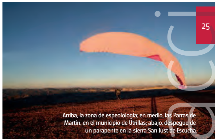
Arriba, la zona de espeleología; en medio, las Parras de Martín, en el municipio de Utrillas; abajo, despegue de un parapente en la sierra San Just de Escucha.