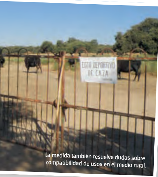
La medida también resuelve dudas sobre compatibilidad de usos en el medio rural.

“aumenta la competitividad y la rentabilidad, reduce el impacto ambiental, diversifica la producción y contribuye a un mayor y mejor uso de las tecnologías de la información y la comunicación (TIC)”.