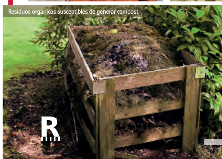
Residuos orgánicos susceptibles de generar compost.