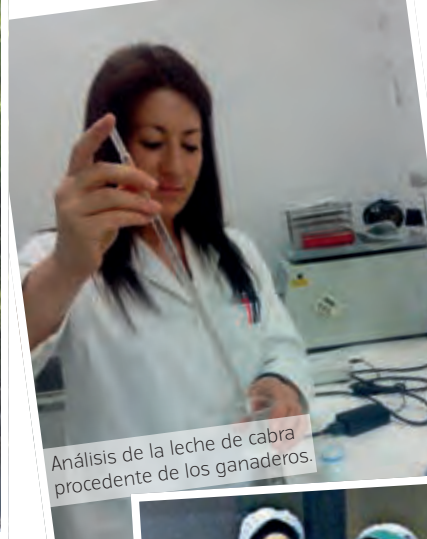
Análisis de la leche de cabra procedente de los ganaderos.