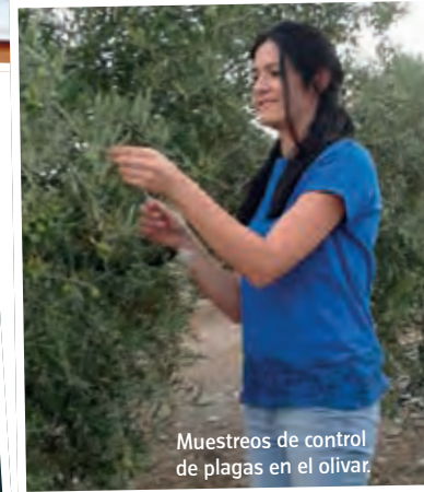
Muestras de control de plagas en el olivar.