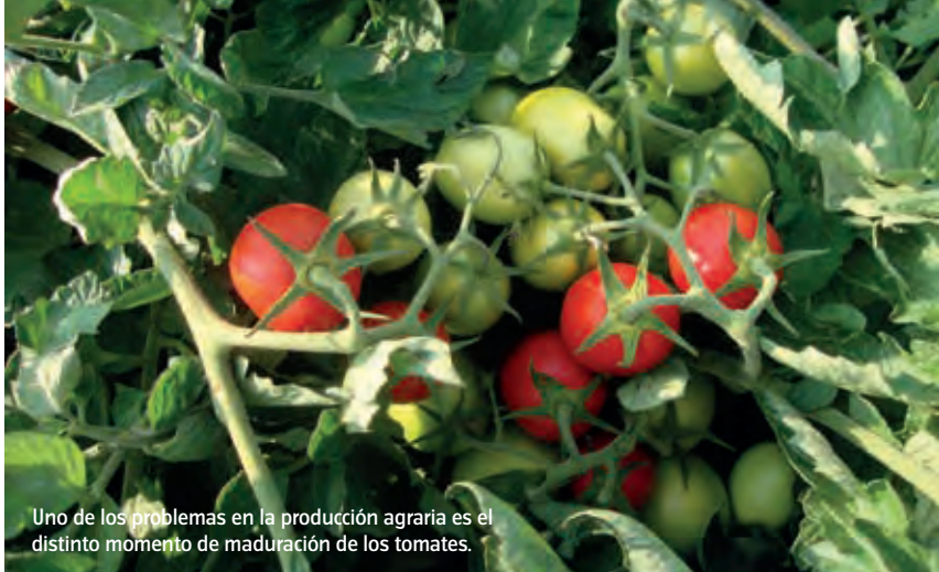
Uno de los problemas en la producción agraria es el distinto momento de maduración de los tomates.

El tomate para industria se encuentra en un gran momento, pero eso no significa que no tenga que seguir avanzando. En este 2016 el sector se enfrenta a grandes retos marcados por la globalización, que exige producir más a menos coste; retos tanto agronómicos como de tecnología de procesos, que serán asumidos en una agenda estratégica de innovación, que llevará a cabo un grupo operativo propuesto por