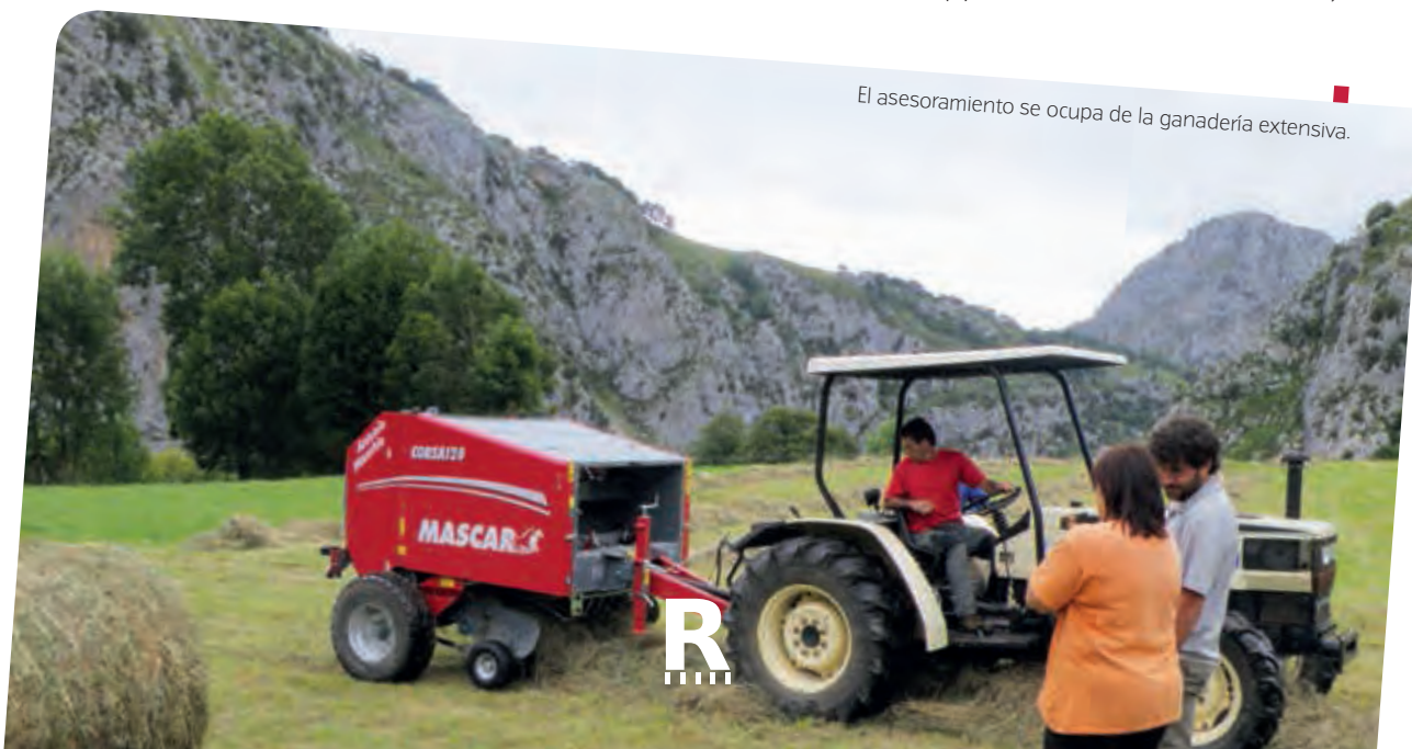
El asesoramiento se ocupa de la ganadería extensiva.

El objetivo es ayudar a los agricultores, especialmente a los jóvenes y de nueva incorporación, a titulares forestales, a otros gestores de tierras y a las pymes de zonas rurales a mejorar la