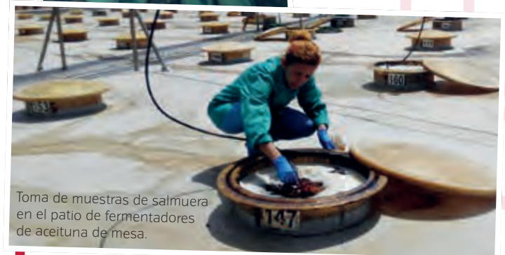
Toma de muestras de salmuera en el patio de fermentadores de aceituna de mesa.

Este es un ejemplo de cómo se han superado los obstáculos de la orografía accidentada de plantaciones y de los mayores costes de laboreo y recolección apoyándose en la modernización de las técnicas de cultivo (cubierta vegetal, olivar de producción ecológica, producción integrada, etc.), el empleo de pequeña y moderna maquinaria y la apuesta decidida por la investigación y la obtención de productos con alto valor añadido. Todo ello desde una perspectiva de igualdad de género que le ha valido, al departamento de Yáñez, el reconocimiento del Premio de Excelencia a la Innovación para Mujeres Rurales que el Ministerio de Agricultura, Alimentación y Medio Ambiente otorgó en 2015. R