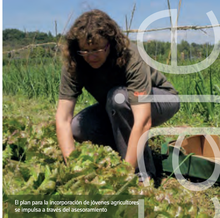
El plan para la incorporación de jóvenes agricultores se impulsa a través del asesoramiento

gestión sostenible y el rendimiento global de sus explotaciones o empresas. La primera novedad es que la medida actual (M2) unifica las dos anteriores contempladas en la programación 2007-2013: utilización de servicios de asesoramiento (M114) e implantación de servicios de sustitución, gestión y asesoramiento (M115).