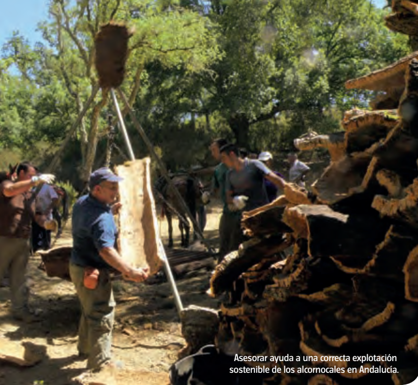
Asesorar ayuda a una correcta explotación sostenible de los alcornoques en Andalucía.