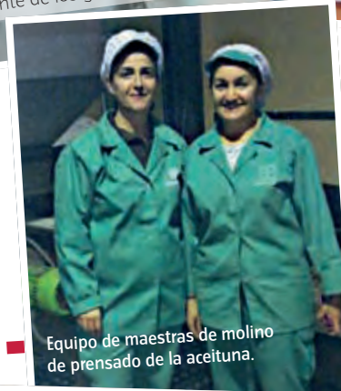
Equipo de maestras de molino de prensado de la aceituna.

Quizás por su firme compromiso por colocar a la mujer rural en una posición relevante, el departamento que dirige es íntegramente femenino. En total, seis mujeres que han conseguido, entre otros logros, obtener vinagre de membrillo “único en el mercado y reconocido mundialmente con la obtención de sus premios” y que actualmente se comercializa en tiendas gourmet . También han doblado la producción de aceituna de mesa, que en pocos años se ha situado en los cinco millones de kilos.