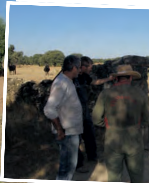
Otros grandes ecosistemas, como los olivares de Castilla-La Mancha, requieren de servicios de asesoramiento.