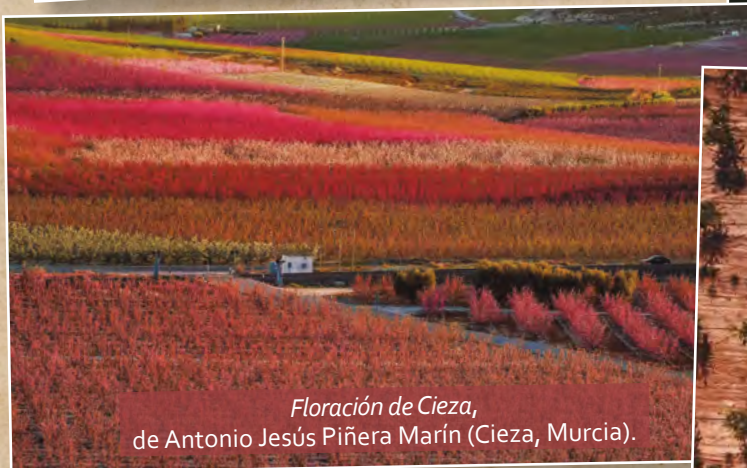
Floración de Cieza , de Antonio Jesús Piñera Marín (Cieza, Murcia).