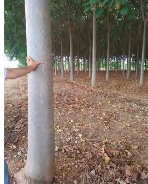
Algunos de los proyectos auxiliados: gestión del ganado ovino, cultivo y aprovechamiento de Paulonia y sistema de comercialización vertical Farmers & Co, (Premio Nacional de Comercio Interior 2017).