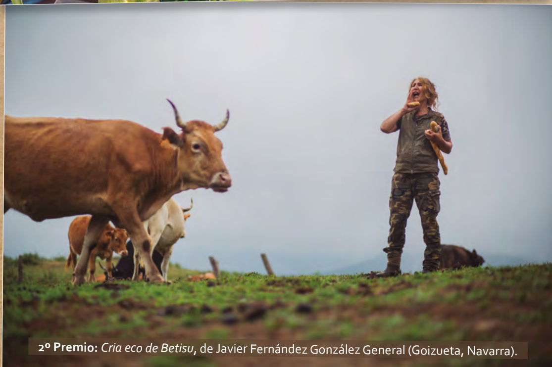
2 o Premio: Cria eco de Betisu , de Javier Fernández González General (Goizueta, Navarra).