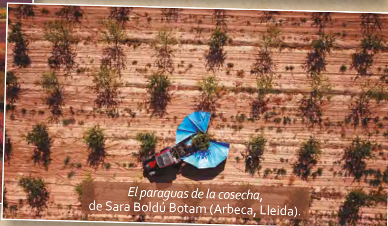
El paraguas de la cosecha , de Sara Boldú Botam (Arbeca, Lleida).