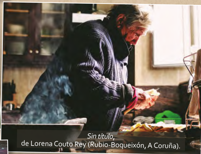
Sin título , de Lorena Couto Rey (Rubio-Boqueixón, A Coruña).