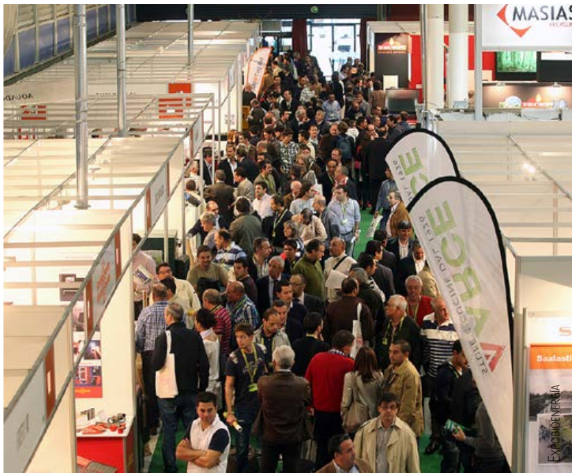
Los participantes en el proyecto Eneral realizaron varias visitas a Expobioenergía, la feria más importante del sector de la biomasa en España.

A partir de aquí quedaba valorar si se habían conseguido los objetivos general y específico de Eneral. El primero consistía en definir acciones para la lucha contra el cambio climático que supongan la puesta en marcha de oportunidades económicas en el medio rural.