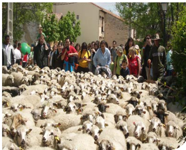
TrashuMad. Acción de divulgación de usos compatibles de las vías pecuarias de la Comunidad de Madrid. Más de 4.000 km al servicio de ovejas y personas.

El crecimiento urbano y la economía a él asociada ha derivado en una sustancial mejora también para quienes viven en municipios rurales. Aunque las diferencias relativas entre la ciudad y el campo