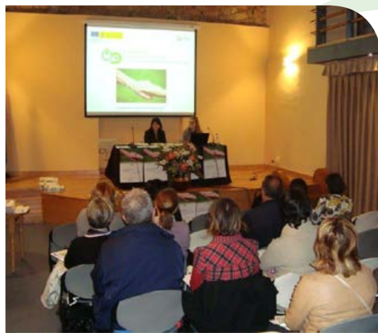
Jornada celebrada dentro del proyecto piloto.

de cuatro comunidades autónomas: comarcas de Aliste y Sayago en Zamora (Castilla y León), zonas de Cabañeros y Promancha (Castilla-La Mancha), el valle del Guadalquivir (Andalucía) y el suroccidente asturiano (Asturias). Aparte de la información a la población local mediante jornadas, folletos y guías, y de incrementar su participación para mejorar la calidad de vida de familiares, cuidadores y personas dependientes, los servicios a través de una demo de la plataforma web les ha permitido visualizar el potencial de desarrollo del proyecto.