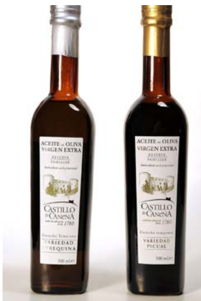
El aceite se hace con tres variedades de árboles: picual, arbequina y royal

No éramos conscientes del potencial que teníamos en frente, no sabíamos que a los nueve años de empezar aquel proyecto íbamos a exportar nuestros aceites a 42 países en el mundo, ganar los premios más prestigiosos, alcanzar la máxima puntuación en la guía referente del sector a nivel mundial (la italiana Flos Olei ) y estar presentes en la carta de los restaurantes y establecimientos más