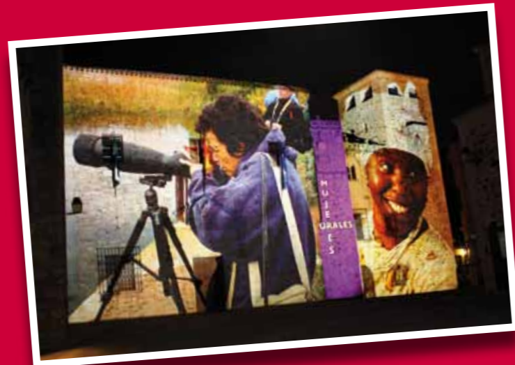
■ Imágenes de mujeres rurales proyectadas sobre dos edificios históricos de la zona medieval de Cáceres.