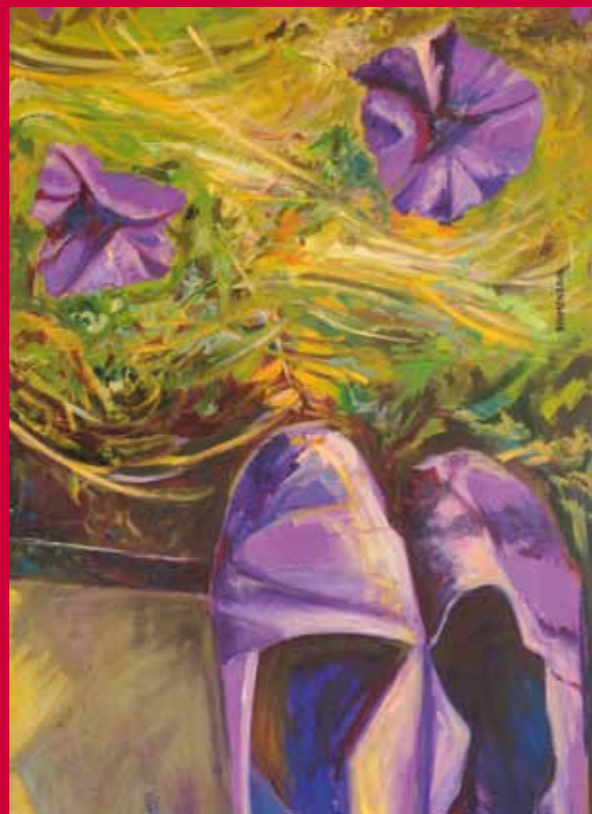
Autora: Consuelo Martínez Flores