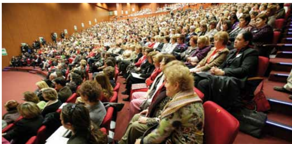
El XXV aniversario de la organización reunió en 2007 en Madrid a más de 2.000 personas, que debatieron sobre el importante papel desempeñado por la mujer en el medio rural.

La Asociación de Familias y Mujeres del Medio Rural nació en 1982 como organización pionera en España con un claro objetivo, que las mujeres rurales dejaran de ser invisibles y que su voz se escuchara en todos los foros nacionales e internacionales para alcanzar el reto de la igualdad real de oportunidades.