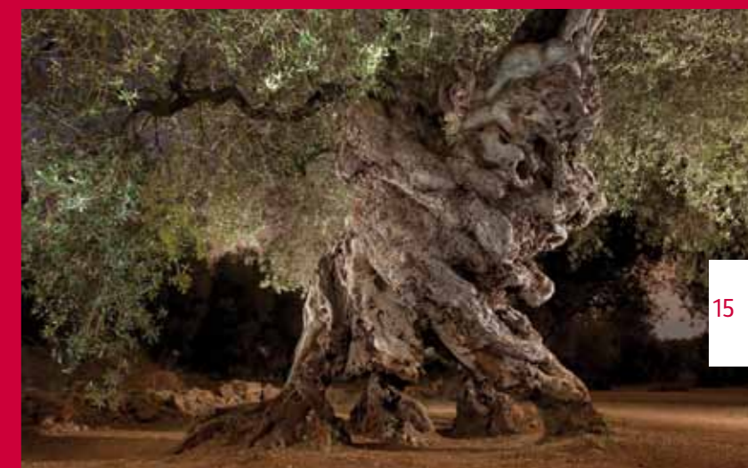
Este olivo milenario de Canet lo Roig (Castellón) es conocido como "el de las cuatro patas", y tiene un perímetro en la base de 10,20 metros.

El inventario de los olivos milenarios ha sido el paso previo que la Mancomunidad Taula del Sénia ha dado, con la colaboración del Servei d'Ocupació de Catalunya, como preparación a la presentación y aprobación del proyecto piloto Aceite y olivos milenarios, motor de desarrollo sostenible del Territorio del Sénia . En total, se han catalogado 4157 árboles de 24 municipios (12 valencianos, 9 catalanes y 3 aragoneses), entre los que también merece que se destaquen dos de Castellón, La Jana, que con 932 tiene más olivos milenarios que habitantes, y Canet lo Roig, que ocupa el segundo