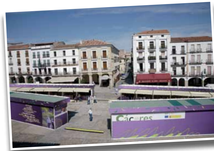
■ Vista general de la zona de la Plaza Mayor, en la que se instalaron las 24 casetas con proyectos de innovación.