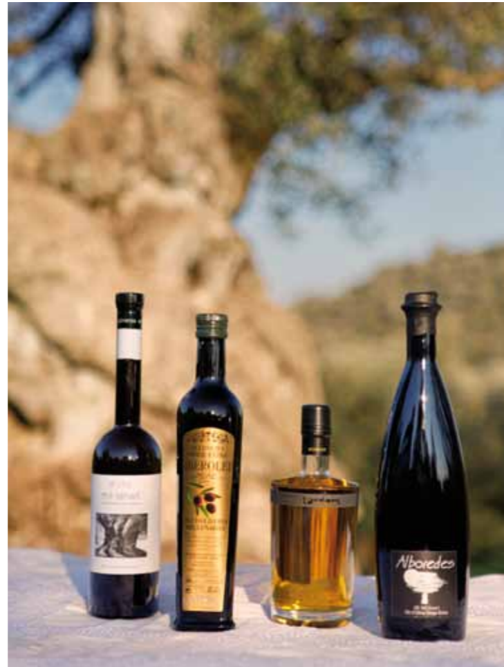
■ Muestras de las cuatro marcas de aceite procedentes de olivos milenarios.

En esta primera fase se han volcado en desarrollar una recolección cuidadosa de la variedad de aceituna autóctona, denominada farga, y en producir un aceite de oliva virgen extra a