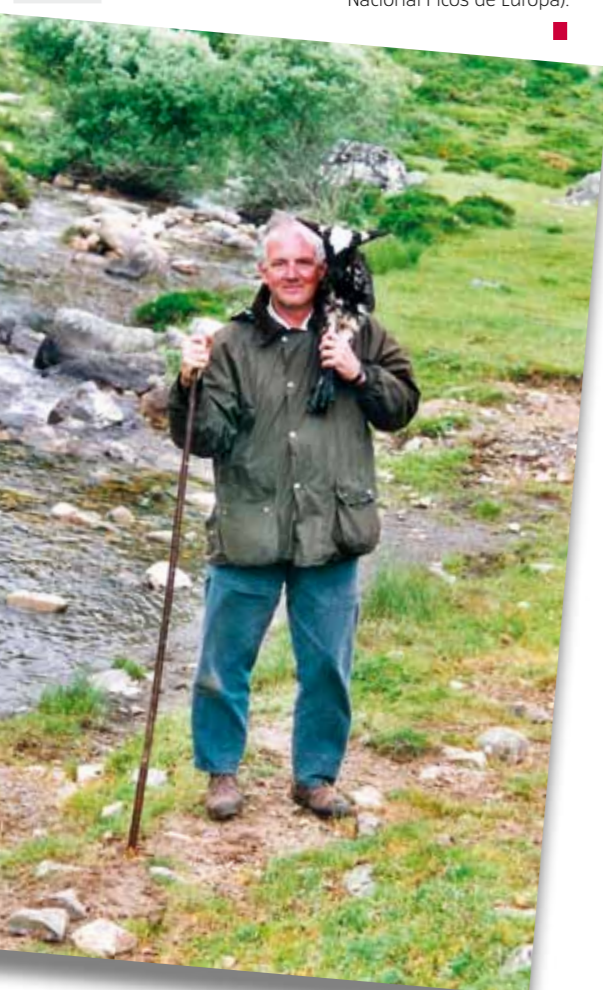
Durante la trashumancia, en ocasiones hay que rescatar un cabrito extraviado (Puerto de Pandetrave. Parque Nacional Picos de Europa).

P: Dicen que la causa ecológica ha ido generando en estos años muchas frustraciones y no pocos resentimientos.