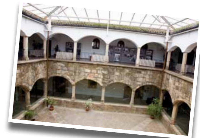
■ Vista general de uno de los claustros de la sede del foro en donde se instaló la exposición Senderos de la memoria , recopilación de materiales fotográficos de gran valor histórico que han sido digitalizados por la mediateca del MARM.