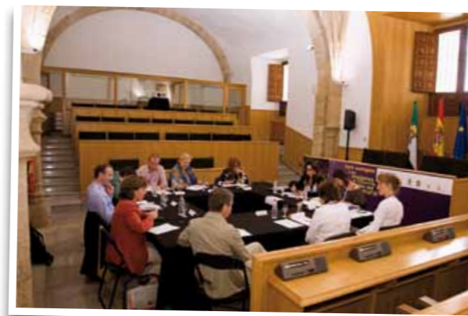
■ Aspecto de una de las reuniones del Seminario Técnico de Países Miembros de la Unión Europea durante los debates sobre la equidad de género.