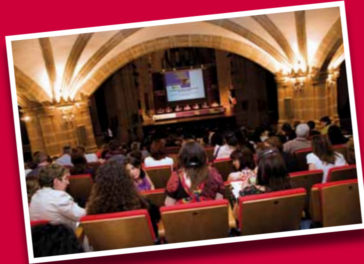
■ Salón de plenos del Complejo Cultural San Francisco durante una de las sesiones plenarias.

Por último, se organizaron diversas actividades culturales en el casco medieval de la ciudad, entre las que destacan: un ciclo de cine rural, tanto comercial como documental, en el que se recogen cintas del antiguo Ministerio de Agricultura que han sido restauradas por el MARM; dos exposiciones fotográficas, una del mismo ministerio y otra del Instituto de la Mujer; y la proyección, sobre edificios emblemáticos de Cáceres, de imágenes relacionadas con mujeres y desarrollo rural. R