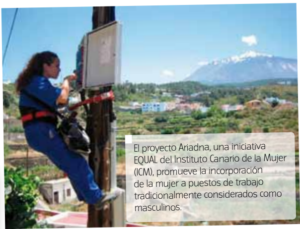
El proyecto Ariadna, una iniciativa EQUAL del Instituto Canario de la Mujer (ICM), promueve la incorporación de la mujer a puestos de trabajo tradicionalmente considerados como masculinos.