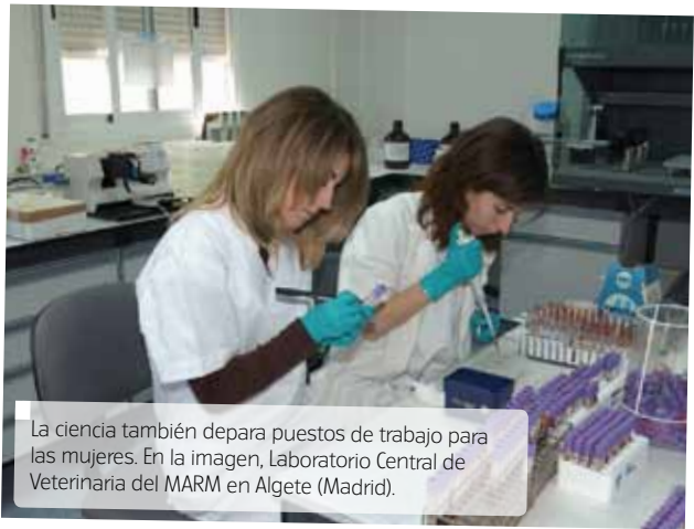
La ciencia también depara puestos de trabajo para las mujeres. En la imagen, Laboratorio Central de Veterinaria del MARM en Algete (Madrid).