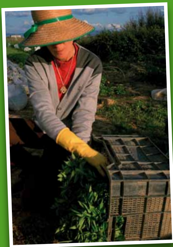
■ Cerca de seis millones de mujeres contribuyen con su implicación y esfuerzo a hacer un poco más visible la labor que desempeñan en el medio rural".

Las mujeres que viven en entornos rurales poco a poco empiezan a ser conscientes del papel que desempeñan en la construcción del nuevo modelo de sociedad rural. Su participación es indispensable tanto en la agricultura familiar, multifuncional y sostenible, como plantea la nueva política agraria común; como en cualquier otro tipo de actividad o iniciativa que se lleve a cabo en el medio rural. Por eso, es necesario incrementar su presencia en las instancias de decisión, y el Ministerio de Medio Ambiente, y Medio Rural y Marino apuesta por impulsar todas las iniciativas que vayan encaminadas hacia ese objetivo. R