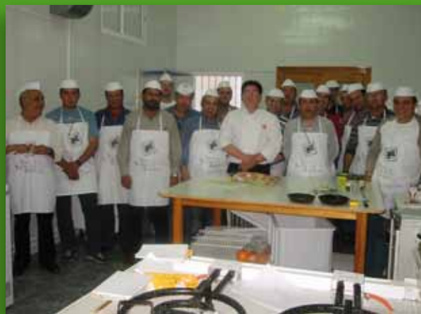
Dos imágenes que reflejan los trabajos del proyecto Talleres de supervivencia doméstica , concretamente el del taller sobre mecánica para mujeres y el de cocina para hombres.