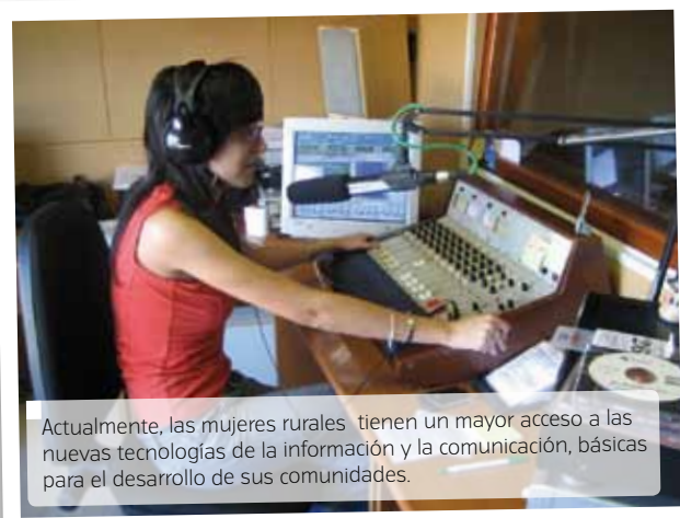
Actualmente, las mujeres rurales tienen un mayor acceso a las nuevas tecnologías de la información y la comunicación, básicas para el desarrollo de sus comunidades.