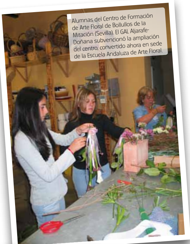
Alumnas del Centro de Formación de Arte Floral de Bollullos de la Mitación (Sevilla). El GAL Aljarafe-Doñana subvencionó la ampliación del centro, convertido ahora en sede de la Escuela Andaluza de Arte Floral.