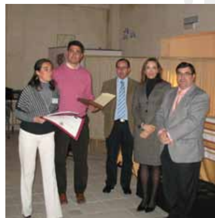
Dentro del proyecto Observatorio virtual de género en el ámbito rural de Andalucía , se entregaron varios reconocimientos a las empresas vinculadas al diseño de planes de igualdad.

Cualquier estudio previo de la situación realizado dentro de las 25 buenas prácticas seleccionadas ofrece datos similares: el Itinerario Red , de la Agencia de Desarrollo Económico de La Rioja, aporta que en el medio rural de la región la tasa de ocupación laboral de las mujeres es del 22,7% y la de varones del 62,7%; y el MAGAP Empleo del Ayuntamiento de Puerto Lumbreras (Murcia) confirma que la tasa de analfabetismo es más del doble entre mujeres, aunque, a mayor nivel de estudios, hay mayor número de mujeres. Pero también se afirma en muchos proyectos que esta última característica suele ir asociada a un mayor éxodo hacia las grandes ciudades debido a que en los pueblos no encuentran ni los medios ni los servicios con los que ampliar y desarrollar sus conocimientos. Es decir, se van en busca de mejores oportunidades laborales y de una menor presión social sobre sus comportamientos.