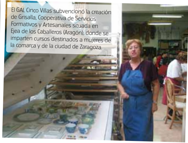
El GAL Cinco Villas subvencionó la creación de Grisalla, Cooperativa de Servicios Formativos y Artesanales situada en Ejea de los Caballeros (Aragón), donde se imparten cursos destinados a mujeres de la comarca y de la ciudad de Zaragoza.