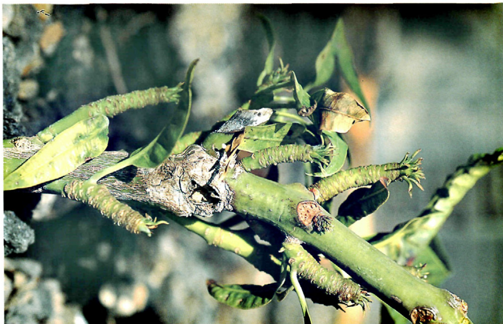
Fig. 3.—Proliferación de yemas en el mango.