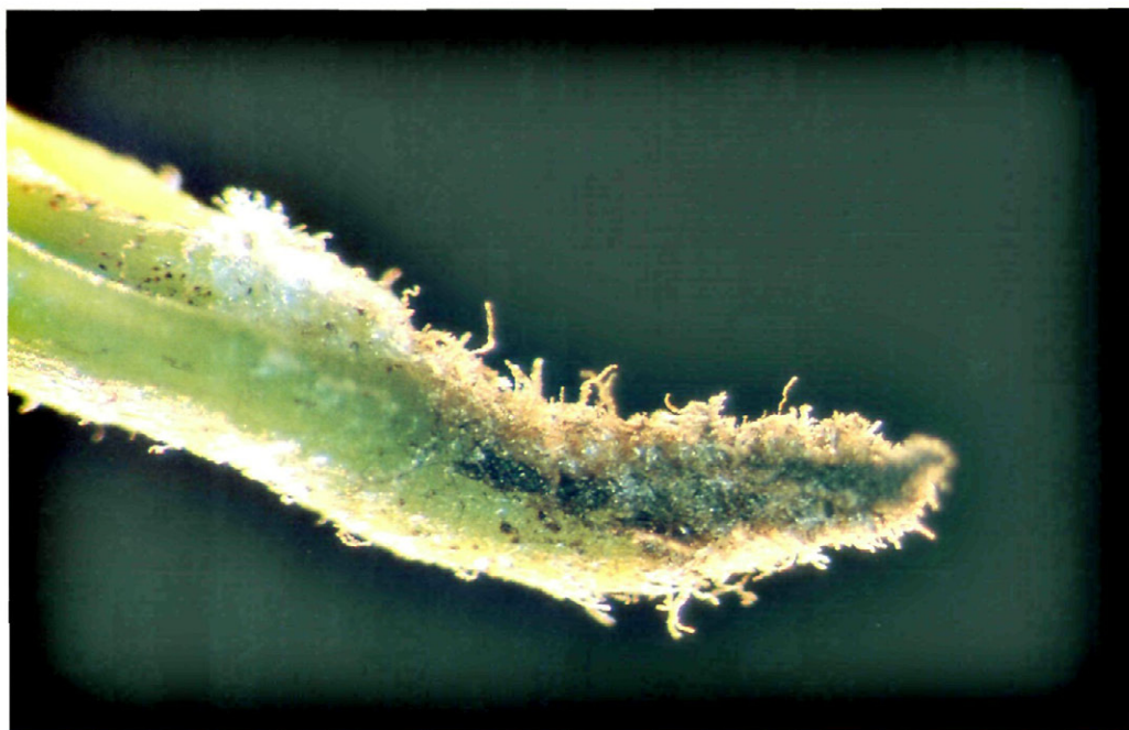
Fig. 4.—Pelos hipertrofiados por el eriófido.