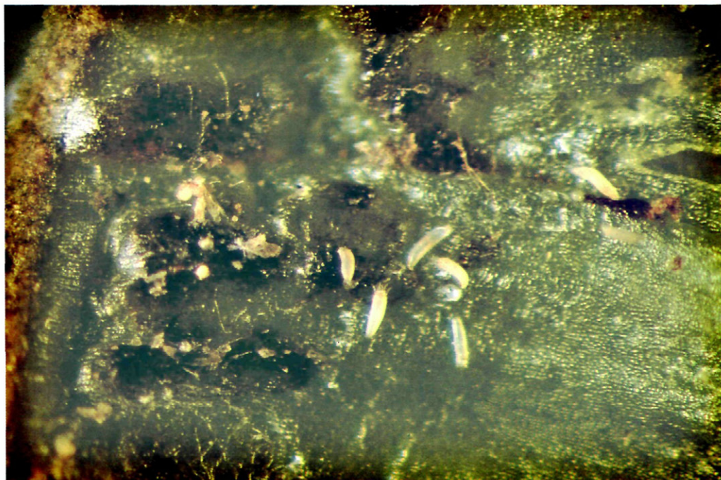
Fig. 1.—Colonia de Eriophyes mangiferae .