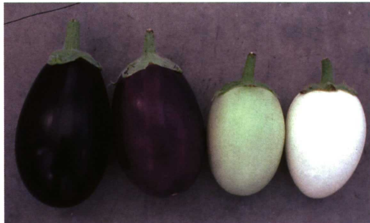
Foto 1. Berenjenas de diferentes colores. El color negro y morado es debido a la acumulación de compuestos fenólicos del tipo de los flavonoides en la piel.

cual le confiere un alto poder antioxidante. Es por ello que el desarrollo de nuevas variedades con un mayor contenido en polifenoles es un objetivo de mejora en este cultivo. Sin embargo, la oxidación de los polifenoles en contacto con el aire produce el pardeamiento de la carne, lo cual es una característica negativa para la calidad aparente del fruto. En este sentido los programas de mejora genética para aumentar el