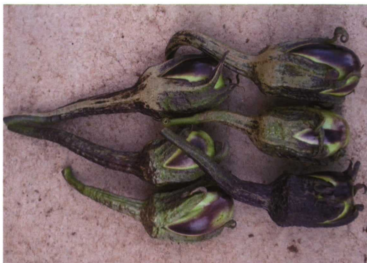
Foto 3. Frutos de berenjena de Almagro, la variedad local española con mayor contenido en polifenoles entre las estudiadas.

ca y genética, sino también para caracteres de composición. A este respecto, los valores más altos se han obtenido en materiales de berenjena de Almagro ( foto 3 ), indicando que este tipo