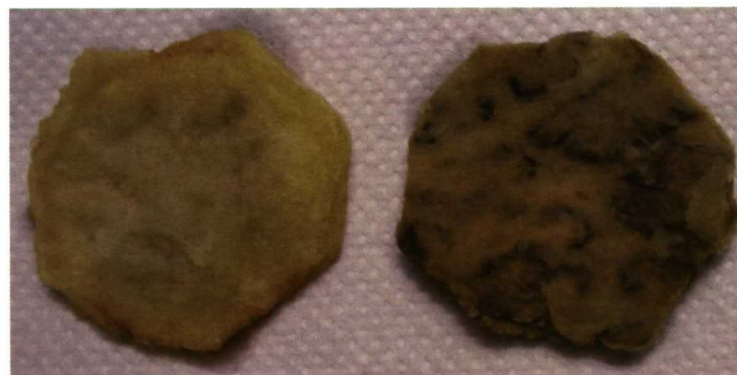
Foto 4. Diferencias en pardeamiento después del proceso de fritura entre una variedad con bajo grado de pardeamiento (izquierda) y otra con alto grado de pardeamiento (derecha).

renjena, la destrucción de los compartimentos celulares permite que los sustratos ortodifenólicos (derivados del ácido hidroxicinnámico) entren en contacto con las polifenoloxidasas, que son enzimas que catalizan la oxidación de estos compuestos a quinonas, las cuales a su vez, reaccionan no enzimáticamente con el oxígeno del aire, aminas, aminoácidos, proteínas y compuestos sulfhidrilos para dar compuestos de color marrón que provocan el pardeamiento. En este sentido, a igualdad de condiciones, a mayor contenido en polifenoles en la carne del fruto, mayor pardeamiento.