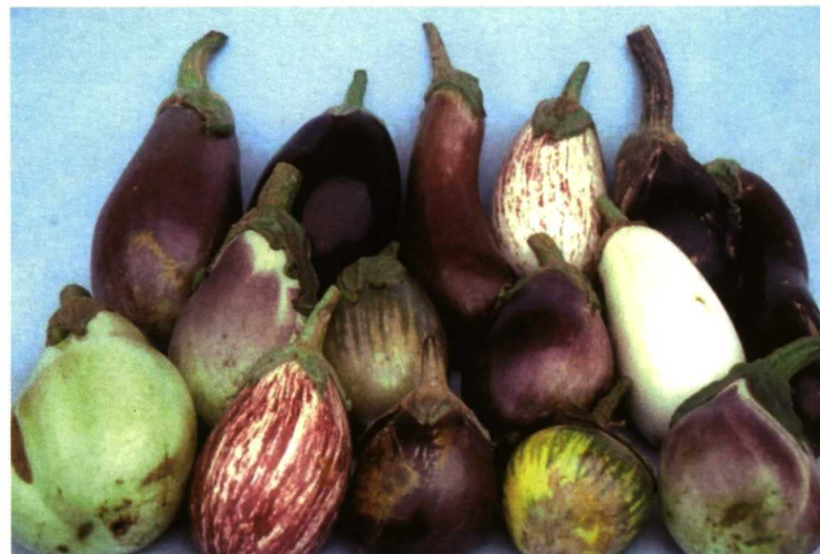
Foto 2. Diversidad en frutos de berenjena de variedades locales españolas.