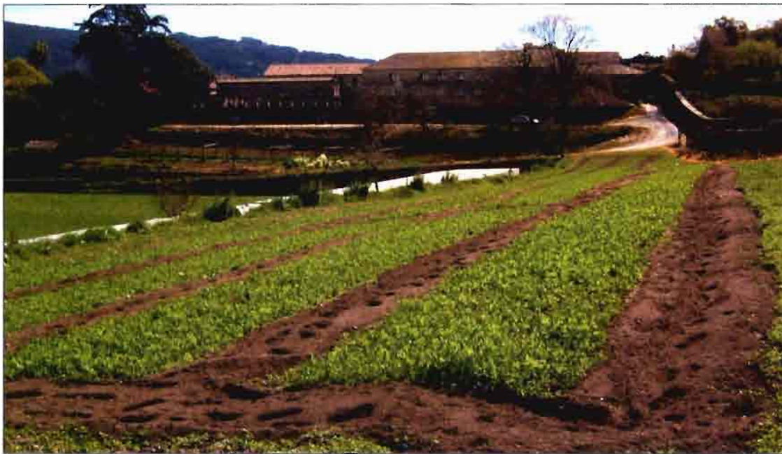
Selección de líneas de mejora a partir de variedades locales.

la degradación del medio. Para un sistema de agricultura sostenible es necesario maximizar la fijación de nitrógeno por medio de leguminosas como el guisante, manteniendo así el pH óptimo del suelo y aumentando la fertilidad del mismo. Además, en la actualidad es posible incrementar el proceso mejorando la eficiencia de la asociación por medio de la doble mejora genética de la planta y de la bacteria, determinando las combinaciones que mejor funcionen en un ambiente dado. Un