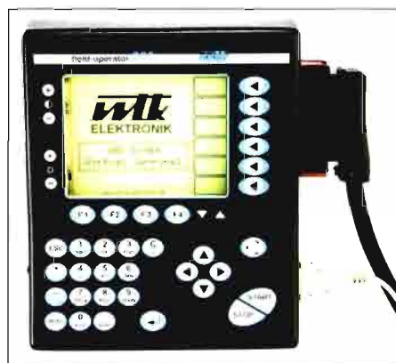
La alemana WTK Elektronik fabrica el Field Operator 205, un terminal universal ISOBUS para cualquier uso o aplicación móvil.

El objetivo de la norma ISO 11783 es proveer de un sistema de interconexión para los sistemas electrónicos. Tiene la finalidad de permitir la comunicación entre unidades electrónicas a tra-