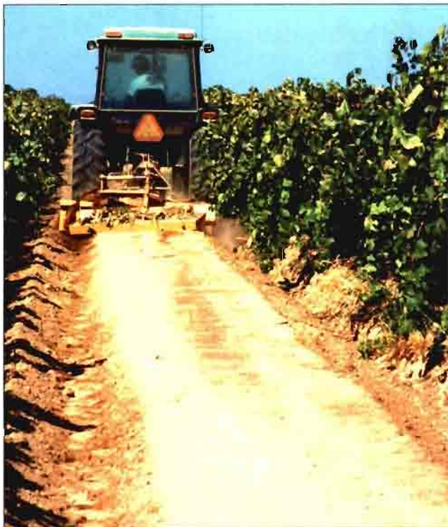
Para formar las terrazas de secado es necesario dar un pase con aperos alomados o aporcadores, según la forma deseada.