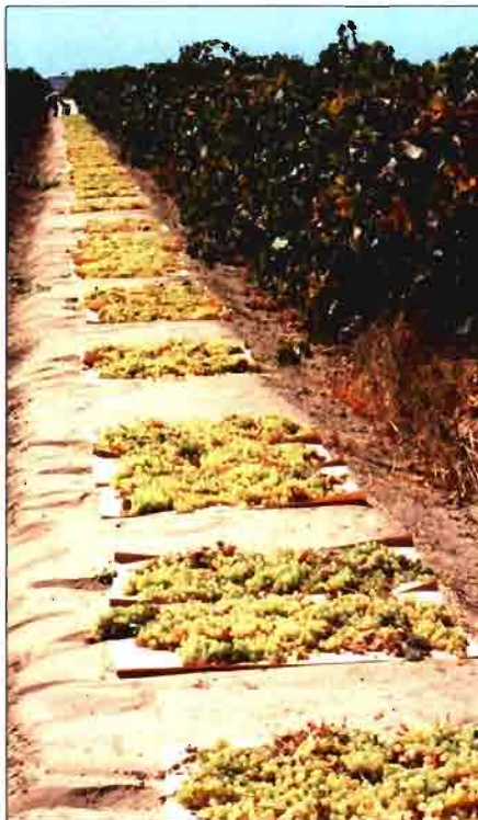
La terraza en forma de meseta permite que el agua de las posibles lluvias drene por ambos lados de las bandejas de papel. (Foto: P. Christensen).