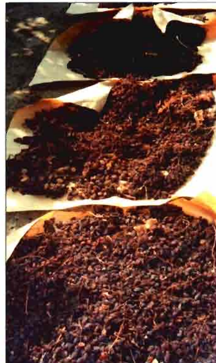
Las pasas no han de quedar caramelizadas por excesivo calor ni insolación, sino uniformemente secas.

cado aceptable (9 kg de uva deben rendir al menos 1,8 kg de pasa).