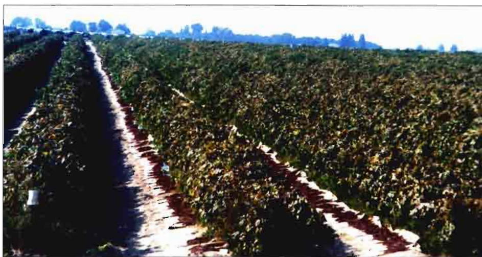
A finales de septiembre los viñedos dedicados a pasificación presentan este aspecto, con las pasas tendidas al sol.

Diseño de la plantación, variedades empleadas y labores de cultivo