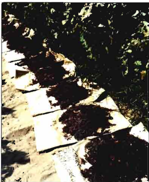
Los racimos son cortados y tendidos sobre papel especial, en lo alto de la terraza formada en cada calle.

Valle de San Joaquín y pueden hacer uso de aguas profundas, es necesario un aporte sustancial de agua de riego para compensar la fuerte evapotranspiración (480 a 660 mm). Durante el inicio de la primavera (abril hasta primeros de mayo), normalmente las aguas invernales son suficientes para cubrir las necesidades de la planta (unos 50 mm), que está abriendo sus brotes y empezando a florecer. Desde la floración hasta el envero (mediados de mayo a julio), el buen ma-