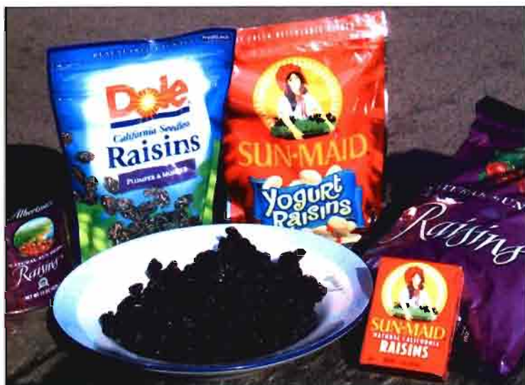
La variedad de envasados y usos culinarios que se les da a las pasas en EE.UU. es notoria, desde la cajita de pasas, como aperitivo energético, hasta las pasas recubiertas de yogur.