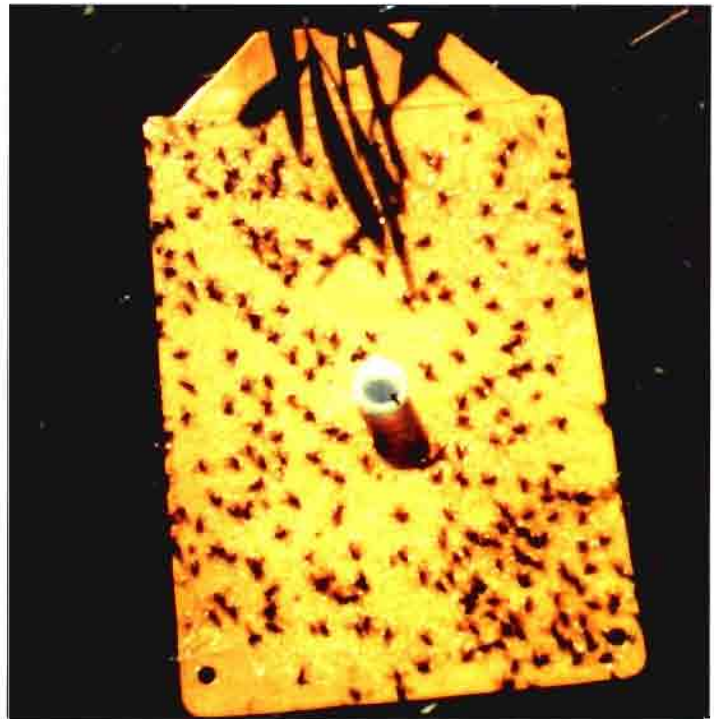
El trapeo sexual es usado en producción integrada para detección de plagas..

dentro de una Asociación de Producción Integrada (API) bajo la dirección de un técnico especializado en PI y siguiendo las normativas legales establecidas en sus respectivas comunidades autónomas;