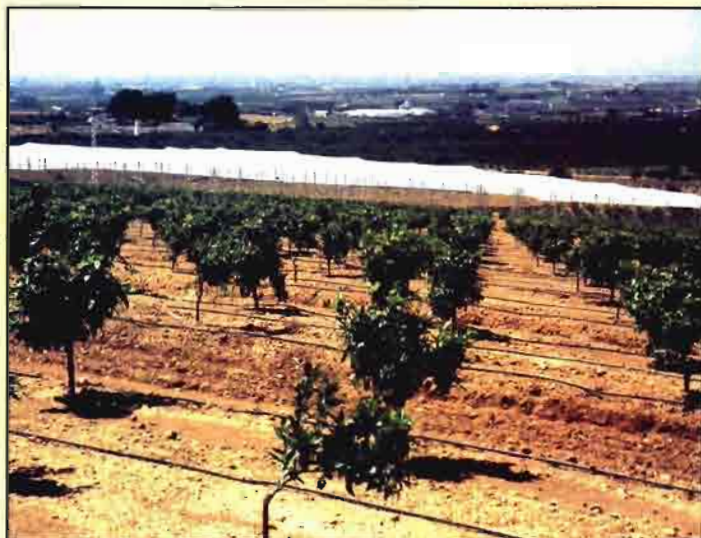
Plantación de cítricos en la Comunidad Valenciana.

En esta breve reseña vamos a describir una serie de programas concebidos específicamente para los distintos cultivos leñosos: Fercitrus (cítricos), Ferprunus (frutales de hueso), Ferpyrus (frutales de pepita), Ferole (olivo), Fervitis (viña de vino y uva de mesa), Ferpúnica (granado) y Farmeler (almendro). Básicamente el esquema es parecido en todos ellos de forma que cuando se maneja uno de ellos ya se pueden utilizar todos los demás. Su finalidad es proporcionar la recomendación de la fertirrigación mensual (semanal o diaria si se quiere) por escrito, en apenas 20 segundos, con la garantía de no cometer errores, si los datos que se le ha proporcionado al ordenador son correctos, para cada cultivo y llegando a particularizar a cada combinación variedad/patrón.