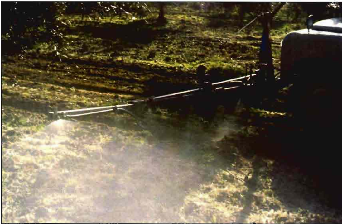
La barra es el elemento fundamental en la aplicación de los herbicidas en olivar, influyendo sobre su eficacia y selectividad para el cultivo, disminuyendo el posible impacto ambiental. Un correcto diseño es fundamental.

La alternancia de materias activas de diferentes familias en años consecutivos es fundamental