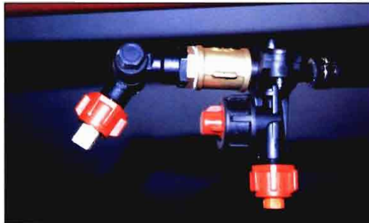
El acceso del herbicida a las zonas interiores de los árboles, en las que también crecen las hierbas, se consigue mediante la instalación de una boquilla excéntrica en el extremo. Es necesario elegir una adecuada combinación entre boquillas en línea y las de extremo, si se quiere tener un reparto homogéneo de la materia activa.

Esta práctica comienza en verano con una perfecta preparación del terreno (limpieza y retirada de restos secos), ruleado y alisado, y finalmente la aplicación de un herbicida para mantener el suelo limpio de hierba hasta el momento de la recolección de las aceitunas. Como es natural estas se recogen del suelo