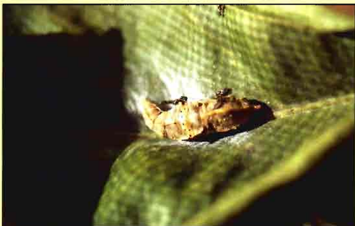
Crisálida de Pieris parasitada por un himenóptero, lo que contribuye a reducir la presión de la plaga de manera natural.

● A. M. D. Servicio de Protección y Sanidad Vegetal. Consejería de Agricultura, Agua y Medio Ambiente. Comunidad Autónoma de la Región de Murcia.