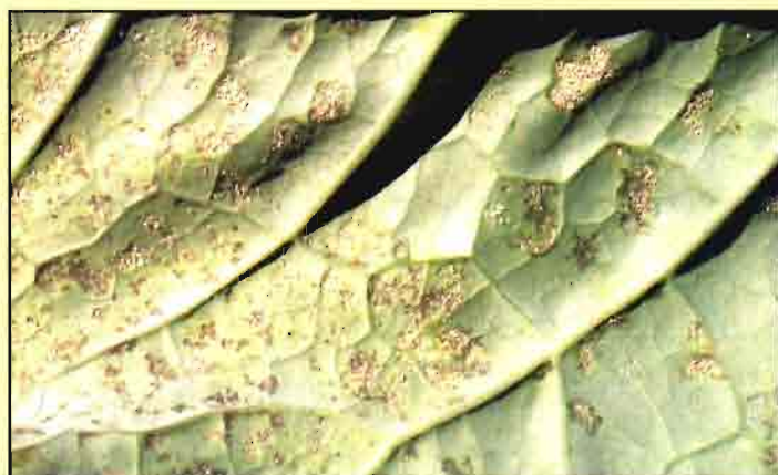
El mildiu en brócoli puede verse favorecido por un exceso de riegos y de abonados nitrogenados.

En plantaciones jóvenes, y especialmente en otoño, pueden realizarse tratamientos con insecticidas biológicos en función de las necesidades, sobre todo en momentos posteriores al trasplante e inicio de formación de la inflorescencia. También se permiten los tratamientos con otros insecticidas especificados en el