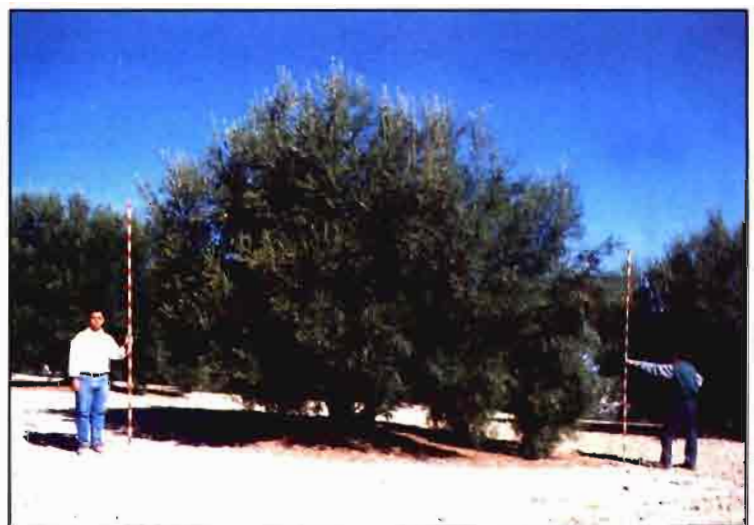
En la programación del riego es fundamental la estimación de la superficie de suelo cubierta por los árboles. Medidas realizadas en un olivar de Torreperogil (Jaén).