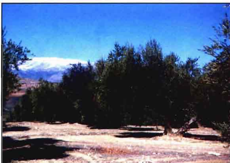
Panorámica de olivar regado por goteo en Huelma (Jaén). Al fondo cumbres nevadas de Sierra Mágina.

En el período fin de verano-mediados de noviembre se produce un gran crecimiento de los frutos, así como la mayor formación y acumulación de aceite en las aceitunas. Es también un momento muy crítico, en especial si durante los meses de verano el olivo ha sufrido déficit hídrico, por lo que de la disponibilidad de agua durante este período va a depender la cantidad de aceite producido, el rendimiento graso de la aceituna y la cuantía de la cosecha. Por otra parte, en esta época el árbol acumula reservas para el año siguiente, dependiendo de las disponibilidades de agua en el suelo la calidad de las flores que se producirán en la campaña siguiente. En un ensayo