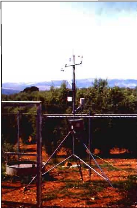
Estación meteorológica automática utilizada para la programación de riegos de olivar. Suministra datos de temperatura, humedad relativa, velocidad y dirección del viento, pluviometría y radiación solar. Se dispone igualmente de un tanque evaporimétrico clase A.

realizado durante 10 años por la Estación de Olivicultura de Venta del Llano (Mengíbar-Jaén) se demostró una gran rentabilidad del agua de riego aplicada en otoño (Pastor y Orgaz, 1994).