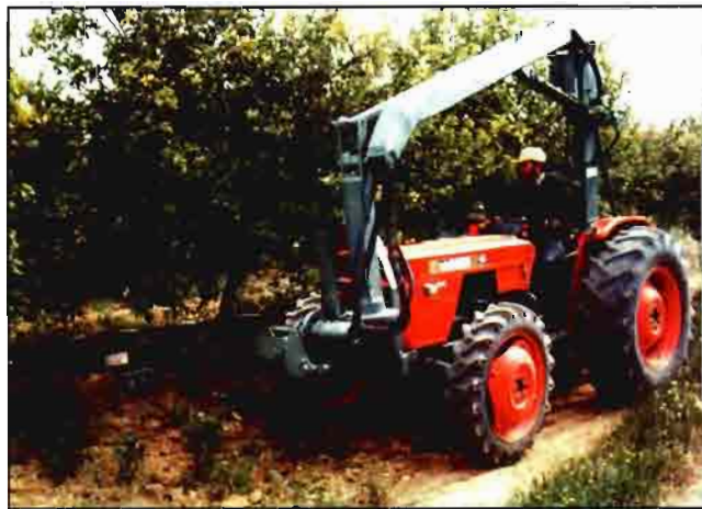
Fig. 3.- Podadora cortando las ramas bajas de los árboles.

Si las ramas a cortar tienen menor diámetro y resistencia, tales como las de los manzanos, perales, etc., que han crecido durante el período vegetativo anterior, se usarán barras de poda formadas por cuchillas triangulares. Para los árboles frutales se han desarrollado cuchillas triangulares unidas a correas que se mueven entre dos poleas, según el esquema de la figura 4 . Una polea es accionada por un motor hidráulico y la otra gira loca arrastrada por la correa. Las cuchillas hacen los cortes mientras se dirigen de una polea a otra por el lado delantero de la barra; tienen filo en un solo