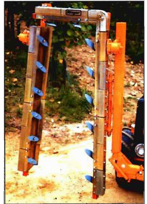
Fig. 6.- Podadora de cuchillas radiales giratorias muy utilizada en las viñas para la poda en verde.

Cualquiera que sea el tipo de tijera accionada, existe en las versiones de corte instantáneo y corte progresivo. Corte instantáneo