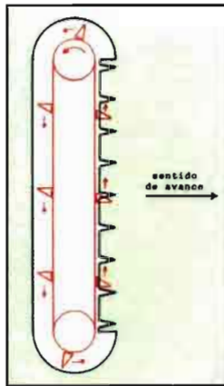
Fig. 4.- Cuchillas triangulares arrastradas por una correa entre dos poleas, carcasa protectora y dedos para cortar por cizalladura.

Según la especie frutal, la labor realizada por la máquina