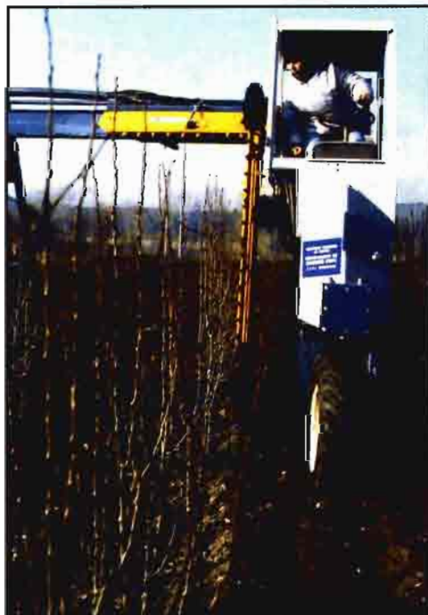
Fig. 5.- Barras de cuchillas colocadas en posición horizontal y vertical pasando sobre una fila de árboles.

Para alcanzar las ramas altas con las tijeras accionadas se han desarrollado dos sistemas: instalar en la plataforma de recolección de fruta equipos de compresión y bombeo para que los podadores pasen junto a los árboles subidos a la plataforma; colocar la tijera en el extremo de una pértiga, mientras el mando para efectuar los cortes se sitúa en la empuñadura al inicio de la pértiga.