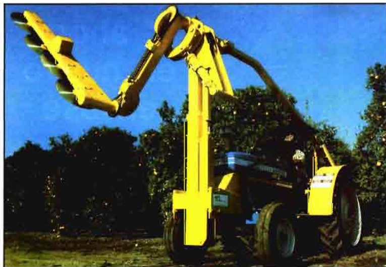
Fig. 1.- Barra de poda compuesta por cuatro discos de bordes dentados.