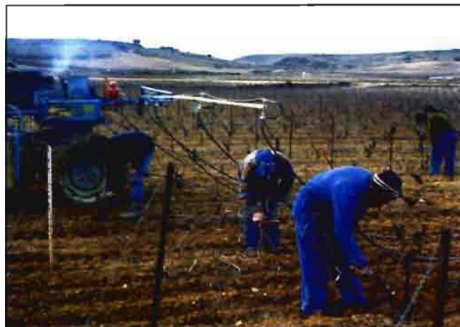
Fig. 7.- Cuadrilla equipada con tijeras hidráulicas recorriendo las filas de una viña.

Aunque el objetivo de este artículo sea describir sólo las máquinas que dan los cortes en los árboles al hacer la poda, los fruticultores que mecanicen su explotación también deben planear el modo de eliminar los restos de poda mediante trituradoras que incorporen al terreno la madera reducida a trozos pequeños. ■