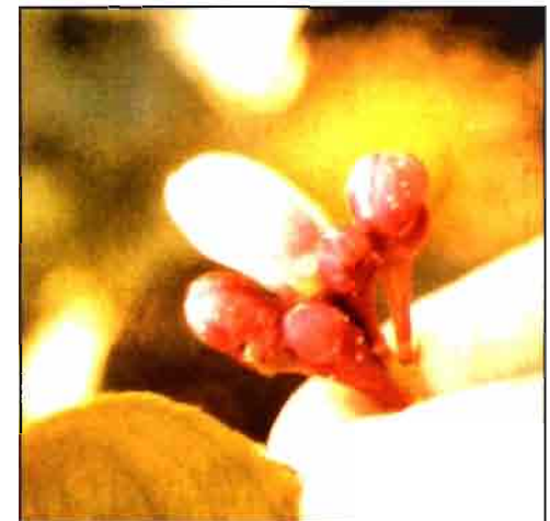
En la foto superior de la pág. observamos un adulto de la polilla de los cítricos. Sobre estas líneas daños en brote producidos por la polilla ( Prays citri ). En la foto de la derecha, flor destruida; y a su lado, puesta en botón floral.

Descripción. El adulto es una mariposa de 10-12 mm. Su cuerpo es gris parduzco y las alas anteriores, con manchas irregularmente distribuidas, entre las que destacan más oscuras, una hacia su mitad y otra al final. Las alas posteriores tienen una coloración más uniforme y están bordeadas por un fleco de pelos largos.