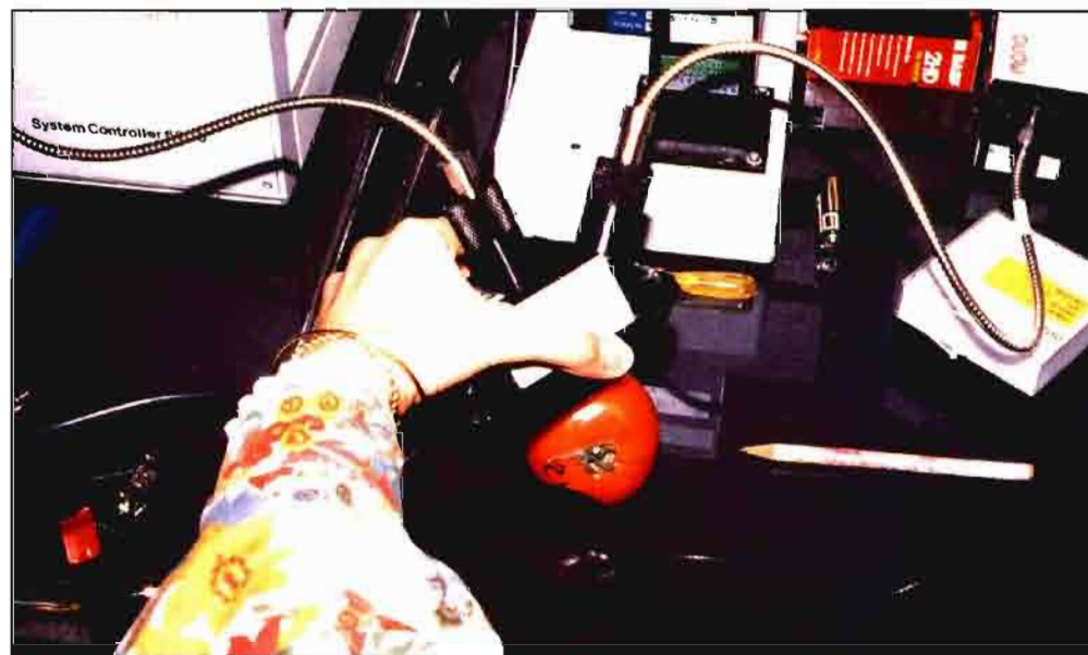
Es posible conocer factores de calidad sin necesidad de dañar el producto.