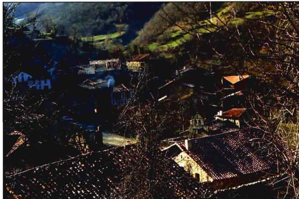
Pueblo en zona montañosa de Cantabria.