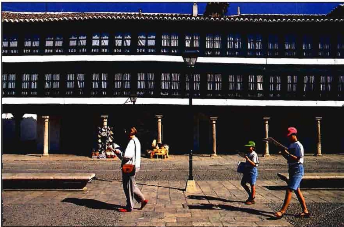
Plaza de Almagro (Ciudad Real).

En esta Comunidad las actuaciones en el ámbito del turismo rural están reguladas por el Decreto 298/1993, de 2 de di-