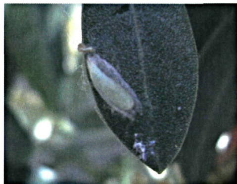
Figura 6. Pupa de la generación antófaga de Prays oleae

La evolución de las capturas en las trampas de feromona se representa en las figuras 7 y 8, en donde se aprecia que el pico de capturas se produce entre finales de mayo y principio de junio, coincidiendo con la emergencia de los adultos que darán lugar a la generación carpófaga. En general, en 2001 se