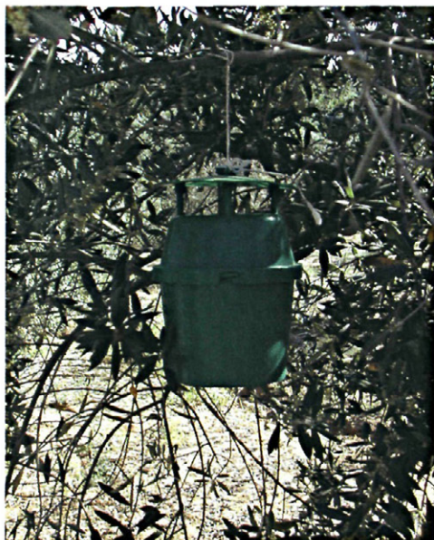
Figura 4. Trampa tipo palillero cebada con feromona sexual para la capturas de machos de Prays oleae .

días, se tomaron del suelo muestras de 25 aceitunas/árbol en 2 árboles por parcela elemental.