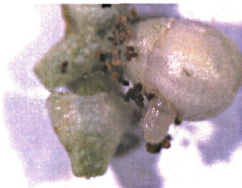
Figura 5. Larva de Prays oleae en botón floral.

Todas las muestras se procesaron en el laboratorio. Las hojas, yemas, inflorescencias y frutos fueron observados para detectar y cuantificar la presencia de huevos, larvas y pupas de P. oleae (Figuras 5 y 6). Todos los