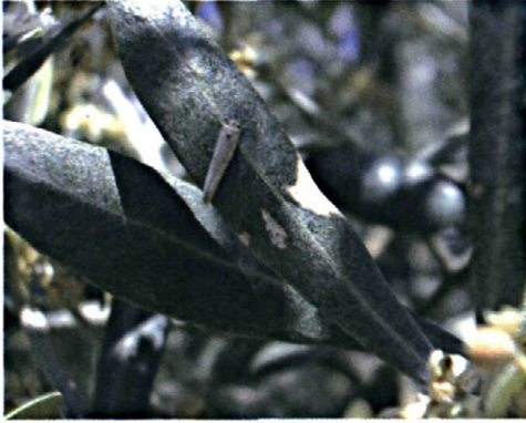
Figura 1: Adulto de Prays oleae Bern.

realizando estudios para conocer la influencia de estos factores en la dinámica poblacional y ecología de las principales plagas del olivo.