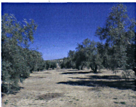
Figura 2: Parcela de suelo desnudo en la finca de ensayo.

Se ha realizado el seguimiento de niveles poblacionales y daños de P. oleae en la finca experimental del CIFA de Cabra (Córdoba)