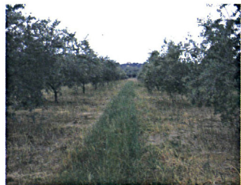
Figura 3. Parcela con cubierta vegetal en la finca de ensayo.

Desde el comienzo de la caída apreciable de aceitunas, y aproximadamente cada 10