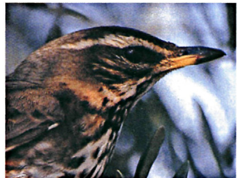
Figura 3: Adulto de Turdus iliacus .

Con respecto a los Olivares Intensivos 2 y 3, no hemos obtenido datos lo que no quiere decir que no haya Turdus iliacus en estas zonas, sino que sus densidades son muy pequeñas.