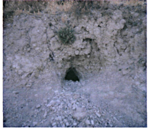
Figura 7: Madriguera de Oryctolagus cuniculus excavada en un padrón presente en el olivar. Esto pone de manifiesto la importancia de conservar las lindes y padrones existentes en los olivares.

Los resultados dan una idea de la elección del medio. Se observa, como apuntan PEPIN (1985), y TAPPER y BARNES (1986), que la selección de hábitat varía con la época del año, ya que la especie utiliza cada medio en el momento fenológico en que éste satisface sus necesidades, en especial las alimentarias.