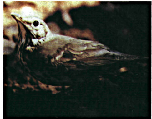
Figura 2: Adulto de Turdus philomelos (Fotografía tomada del libro "Control de Plagas y Enfermedades del Olivar" editado por el Consejo Oleícola Internacional, con la autorización de su autor Manuel Civantos López-Villalta).

Como podemos ver en el Cuadro 2, Turdus philomelos comienza a entrar en los olivares de la provincia de Jaén en el mes de octubre, procedentes del centro y norte de Europa en busca de condiciones adecuadas para la invernada (SANTOS, 1980; SANTOS y TELLERIA, 1985), siendo el alimento uno de los factores fundamentales, y destacando para esta especie la aceituna (MUÑOZ-COBO y PURROY, 1980; SANTOS, 1980; TEJERO et al. , 1982; MANZANARES, 1983; SUAREZ y MUÑOZ-COBO; 1984; MUÑOZ-COBO, 1987). La entrada puede calificarse de relativamente temprana, al menos frente al zorzal alirrojo, de manera que en octubre ya existe una elevada densidad de este zorzal en los olivares, alcanzando el máximo en los meses de diciembre y enero. Esta especie de zorzal al