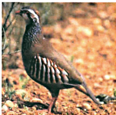
Figura 4: Presencia de Alectoris rufa en el olivar.

listas, principalmente trigo, y presentar puntos de agua en balsas de riego, arroyos, etc., ya que la presencia de agua es indispensable para la tórtola.