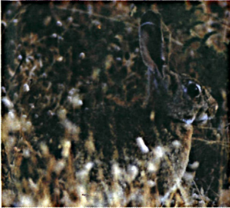
Figura 6: Adulto de Oryctolagus cuniculus L. (Fotografía tomada del libro "Control de Plagas y Enfermedades del Olivar" editado por el Consejo Oleícola Internacional, con la autorización de su autor Manuel Civantos López-Villalta).