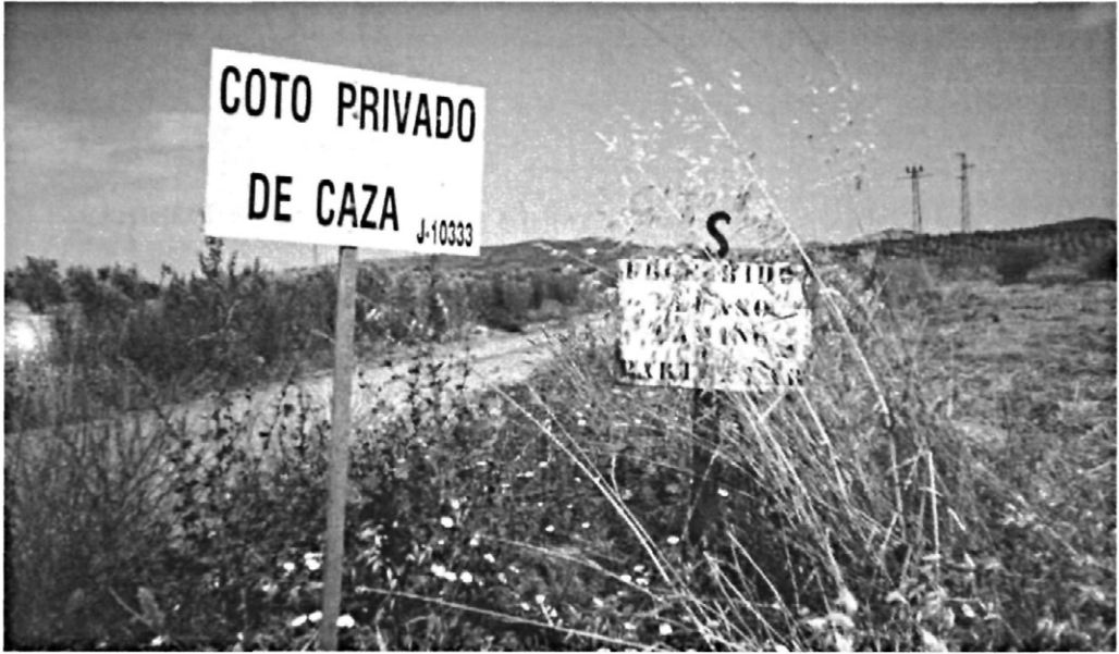
Figura 1: Aprovechamiento del Olivar como coto de caza menor, gestionado por sociedades de caza.

rios, la concentración parcelaria y la mecanización, han sido nefastos para la caza menor (BARATO, 2000).