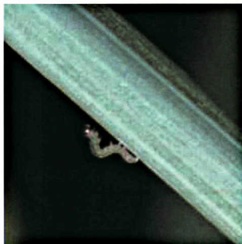
Fig. 3. - Larva neonata de M. unipuncta .

Para estudiar el desarrollo en laboratorio de M. unipuncta en cámara climática a 25°C, 16:8 (luz:oscuridad) y dieta semisintética (EIZAGUIRRE y ALBAJES, 1992) se partió de una población adulta recogida en trampas de luz. En jaulas de reproducción (cajas de metacrilato de 50 x 50 x 50 cm) se introdujeron adultos de ambos sexos con plantas de maíz y agua azucarada para su alimentación.