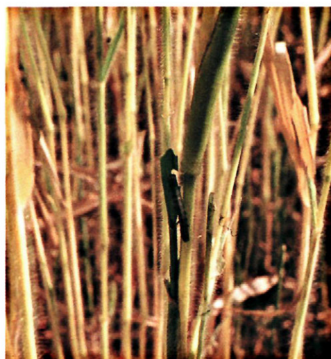
Fig. 8. Plantación de mijo con fuerte ataque de M. unipuncta .