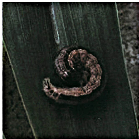
Fig. 4. - Larva de M. unipuncta .

Para llevar a cabo el seguimiento de los vuelos de adultos se colocaron en rastrojos y campos de maíz trampas de luz desde la pri-