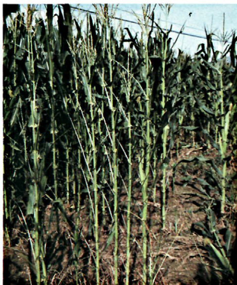
Fig. 7. Plantación de maíz con fuerte ataque de M. unipuncta .