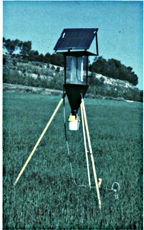
Fig. 5. - Trampa de luz.

En nuestra zona, M. unipuncta ha presentado los dos años 4 vuelos de adultos. El primero la segunda quincena de mayo - primera quincena de junio; el segundo a mediados del mes de julio; el tercero a finales de agosto; y el cuarto durante el mes de octubre. Una de las características indicadas por BALACHOWSKY (1972) en referencia al ciclo evolutivo de M. unipuncta es el voltinismo, presentando la especie distinto número de generaciones en función de la zona. Así, se han registrado desde 2 en Canadá, algunos estados de EE.UU. y el Norte de China hasta 6 u 8 en Kouang Toung. Respecto al ciclo anual en el sur de Francia, BALACHOWSKY (1972) habla sólo de tres generaciones anuales, pero indica que los adultos se encuentran desde abril hasta diciembre. La primera generación está compuesta por insectos que han invernado en la zona, los cuales continuarán reproduciéndose en el mismo sitio o emigraran al norte. La segunda generación comprende los descendientes sedentarios de la primera