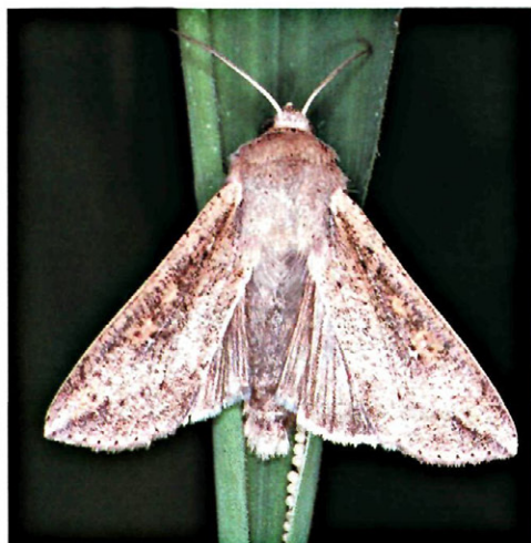
Fig. 1. - Adulto de M. unipuncta .