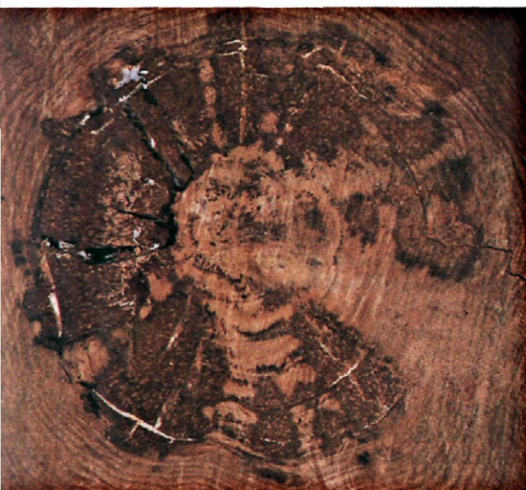
Fig. 1. - Detalle del tronco de uno de los cipreses afectado por la podredumbre cúbica.

tech). Se siguieron las instrucciones del fabricante, pero sin añadir \beta -mercaptoetanol ni RNase (MARTÍN y GARCÍA-FIGUERES, 1999). El DNA se resuspendió en 100 \mu l de agua estéril (FLUKA, Ref. 95395).