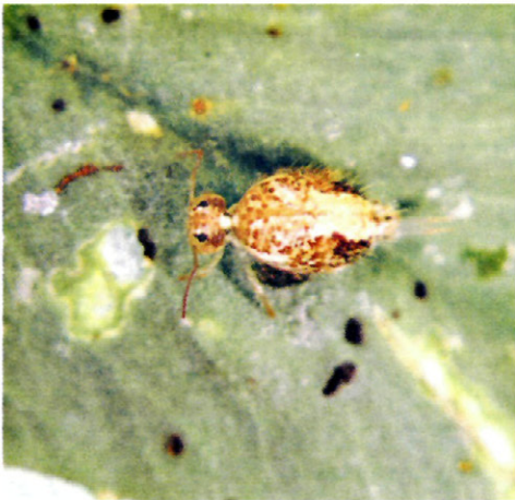
Fig. 3. - S. viridis L. sobre hoja de alfalfa y escarificaciones que realiza sobre la hoja.

conocida como «pulguilla» de la alfalfa, y es considerada como causante de daños en este cultivo y estudiada su evolución en algunos campos de la región de Aragón (GIMENO, F., PERDIGUER, A., 1993), pero sin aportarse datos que permitan conocer la densidad de insectos en el cultivo.