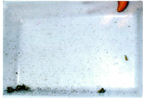
Fig. 4. - Bandeja para el muestreo después de un solo golpe sobre la parte alta de las plantas de alfalfa.

La información sobre la producción en la zona ha sido obtenida gracias a la colaboración de la empresa Alfalfas Osés Resano, que es la principal transformadora de la alfalfa cultivada en la zona. Los datos comparativos de las campañas 1996 y 1997 en la finca mencionada de la localidad de Vergalijo, de 18.18 ha, hablan de una diferencia total de 51.610 Kg. (2.839 Kg. por ha). En la campaña de 1997 hubo un corte menos que en la de 1996 y dadas las condiciones de la planta al final de la campaña se optó por introducir al ganado directamente en el campo.