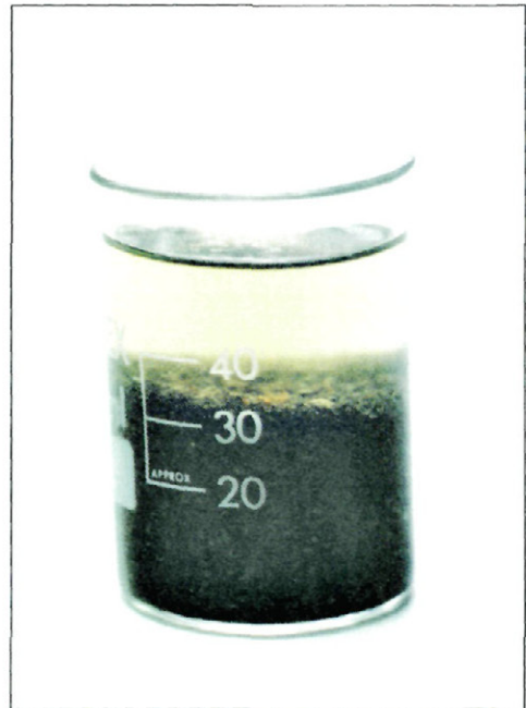
Fig. 5. - Volumen ocupado por la muestra estudiada de S. viridis y E. schoetti , después de extraída la fauna acompañante de moluscos, coleópteros, etc. Este volumen es el resultado de 25 golpes con la bandeja.

A pesar de la mayor pluviosidad total en el año 1997, no se puede responsabilizar de la disminución de producción exclusivamente a las condiciones climatológicas, sobre todo porque desde el mes de septiembre las cantidades de agua caídas en la zona fueron simi-