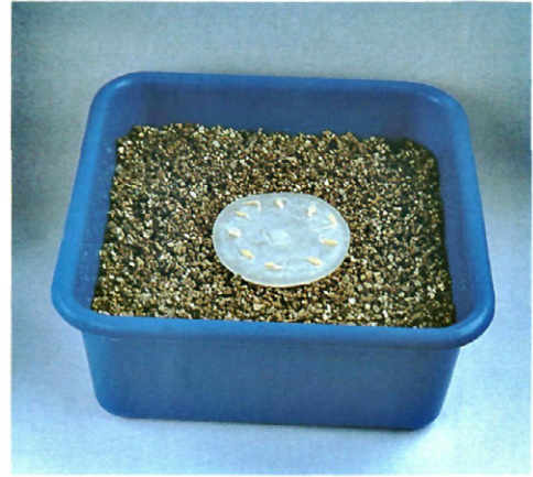
Fig. 2.—Dispositivo para el estudio del poder patógeno de los aislamientos de Pythium : 10 semillas pregerminadas de pepino (var. Negrito) sobre un disco de medio agarizado con el aislamiento a estudiar, dispuesto sobre vermiculita desinfectada humedecida.