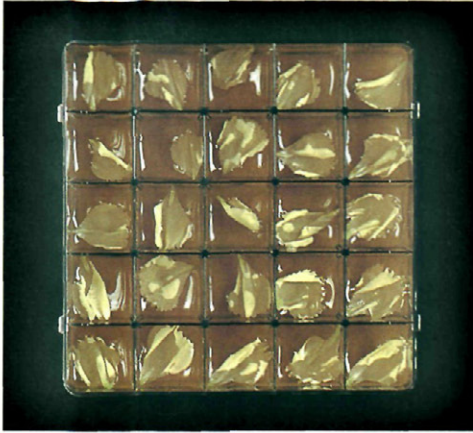
Fig. 1.—Test de detección de Pythium : placa de cultivos celulares conteniendo en cada alveolo una submuestra de suelo y un cebo vegetal (pétalo inmaduro de clavel).