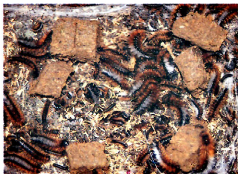
Fig. 1.—Larvas de O. baetica .

— Borago officinalis L. (Boraginaceae), Sylivum marianum (L.) Gaetner (Asteraceae), Malva sylvestris L. (Malvaceae), Mercurialis annua L. (Euphorbiaceae) y Erodium ciconium (L.) L'Hér (Geraniaceae)— y una cultivada, Vicia faba L. (Papilionaceae).