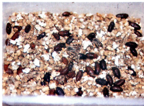
Fig. 2.—Crisálidas e imagos machos.

El procedimiento que se ha seguido para la realización de los experimentos ha consistido en aislar individualmente orugas de cuarta edad en recipientes cerrados de 130 cc con el alimento correspondiente, en forma de tres discos foliares de 2 cm de diámetro, que previamente se habían pesado. Para determinar la preferencia de alimento se realizaron 30 repeticiones con cada planta ensayada y, en cada caso, se dejaron 10 recipientes sin larva, para esta-