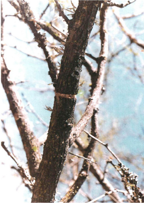
Fig. 7.—Corte circular de Oncideres saga Dalman en Prosopis alba .