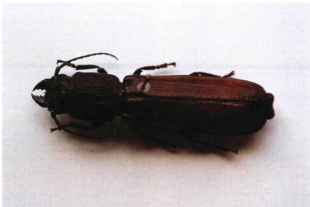
Fig. 2.— Torneutes pallidipennis Beich.