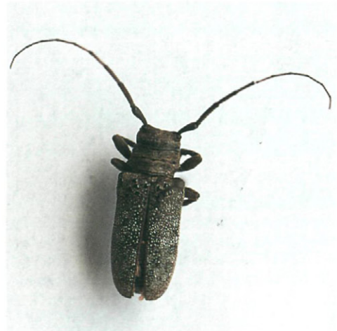
Fig. 6.— Oncideres saga Dalman.