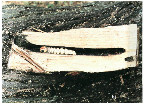
Fig. 1.— Criodion angustatum Buquet.