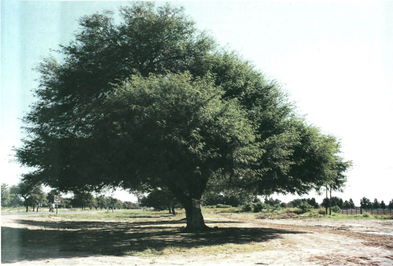
Fig. 5.— Prosopis nigra .