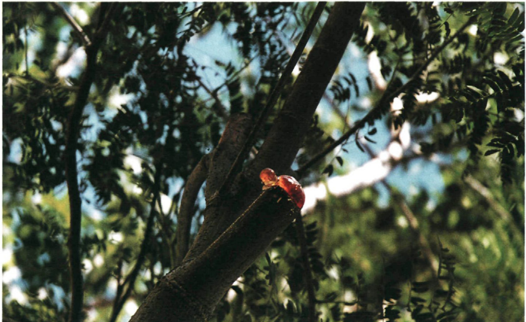
Fig. 8.—Daños causados por Oncideres saga Dalman.

El corte circular interrumpe la circulación de la savia, con lo que las ramas se secan paulatinamente. Los diámetros de dichas ramas varían desde 1,3 a 7 cm: si son delgadas, suelen desprenderse del árbol por su