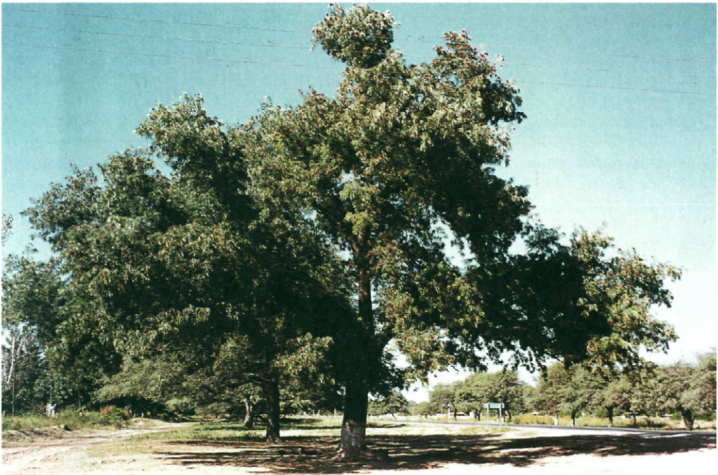
Fig. 4.— Schinopsis quebracho-colorado .