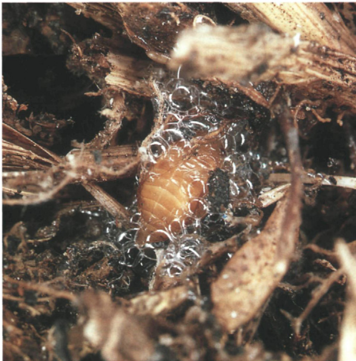
Fig. 6.-Salivazo conteniendo una ninfa.