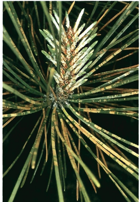
Fig. 1.—Ramillo dañado por los adultos de Haematoloma dorsatum (Ahrens), en el que se aprecia el último crecimiento sin afectar.

Pese a la espectacularidad de los daños, cuando éstos se manifestaban no se encontraba ningún agente defoliador concreto y es que éste (Fig. 2) es el homóptero cercópido Haematoloma dorsatum (Ahrens) cuya presencia sobre los pinos no es masiva, y tiene lugar durante un relativamente corto período de tiempo al final de la primavera y principio del verano. En esta época los imagos del insecto se muestran muy activos saltando de unos pinos a otros y sobre el matorral y vegetación herbácea acompañantes.