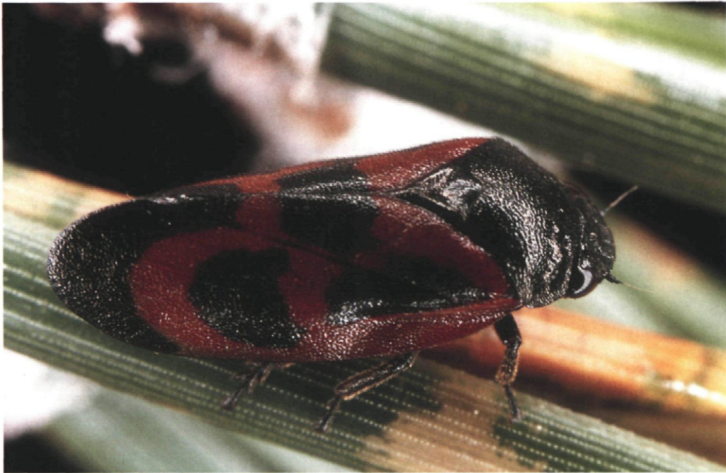
Fig. 2.—Imago de Haematoloma dorsatum (Ahrens).

Los adultos de estos chupadores clavan sus estiletes a través de los estomas en las acículas de los pinos para, tras inyectar saliva, succionar la savia (ROVERSI et al. , 1989). Esta acción se traduce en una reacción fisiológica de la acícula consistente en la decoloración de los tejidos afectados (Fig. 3), que anillan transversalmente a la misma. Al cabo del tiempo y ya cuando los adultos han desaparecido, estas decoloraciones verde-claro se vuelven rojizas para terminar más o menos de color pardo. Esta es la razón por la cual el agente causal de estos daños suele pasar desapercibido para el observador ya que su alarma se produce cuando ya los adultos han concluido su período de vuelo.