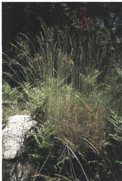
Fig. 7.— Festuca elegans Boiss.

Aunque Haematoloma dorsatum ha sido encontrado en Italia atacando a especies de los géneros Abies Miller, Cedrus Trem., Cupressus L., Juniperus L., Picea A. Dietr., Pinus L. y Pseudotsuga Carrière (COVASSI et al. , 1989), en España solamente ha sido citado en el Sistema Ibérico, causando daños en las provincias de Teruel y Zaragoza sobre Pinus nigra ssp. nigra (Hoess), P. nigra ssp. salzmanni (Dunal) Franco, P. halepensis Miller y P. sylvestris L. (HERNÁNDEZ-ALONSO et al. , 1992) y sobre Pinus ponderosa Lawson, P. jeffreyi Greville y Balfour y P. brutia Tenore de una parcela experimental del municipio turolense de Albarracín (NOTARIO et al. , 1981), siendo ésta la primera vez que se le detecta en España sobre Pinus pinaster Aiton y en el Sistema Central.