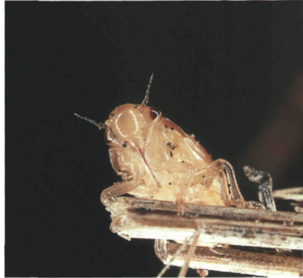
Fig. 5.-Detalle del aparato bucal chupador de una ninfa.