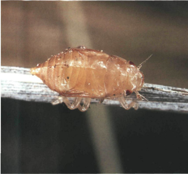
Fig. 4.-Vista dorsal de una ninfa.