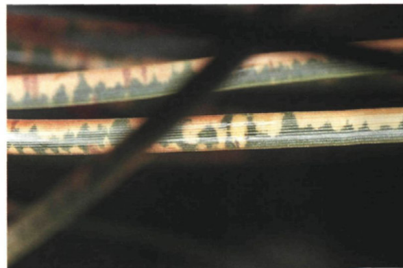
Fig. 3.—Detalle de las decoloraciones anulares de las acículas causadas por el insecto chupador.

Por el contrario, las ninfas (Figs. 4 y 5) nacidas al principio de la primavera, de los huevos que los adultos ponen en la base de los tallos de la vegetación herbácea, se alimentan durante toda la primavera en la base de dicha vegetación, envueltas en un refugio