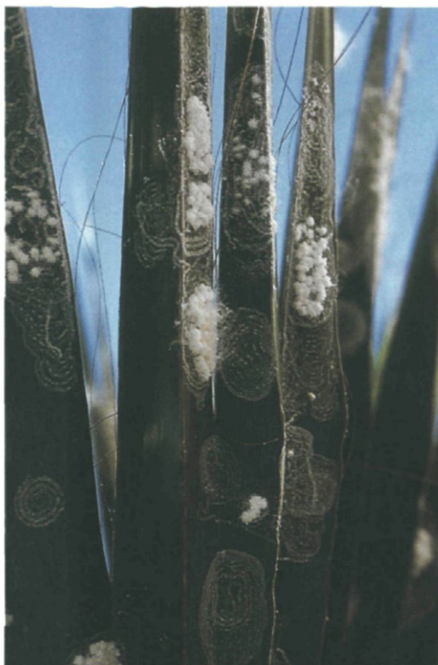
Fig. 7.—Hoja de palmera ( Washingtonia filifera ) con detalle de puestas y de borra algodonosa.