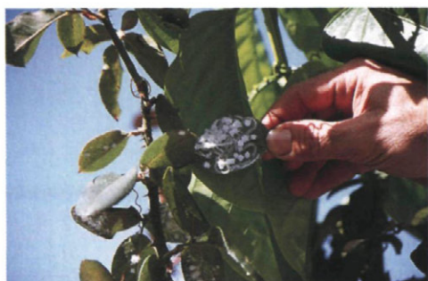
Fig. 5.—Puestas de Aleurodicus en el envés de una hoja de rosal, donde se puede apreciar la abundancia de secreción algodonosa y polvillo blanco con que son recubiertas.

enemigo natural. Las larvas de tercer y cuarto estadio comienzan a segregar la melaza y forman la masa algodonosa que las protege.