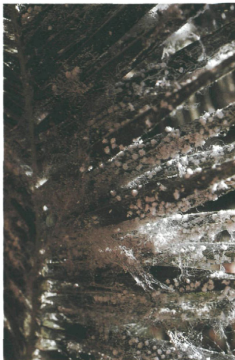
Fig. 8.—Ataque intenso en hoja de palmera ( Washingtonia filifera ), donde se puede apreciar la sintomatología en la cual llega a marchitarse la superficie foliar.