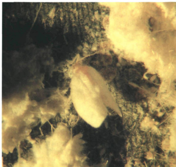
Fig. 3.—Adulto de Aleurodicus dispersus Russ.

Viven en el envés de las hojas, aunque la puesta se puede realizar en el haz, en el