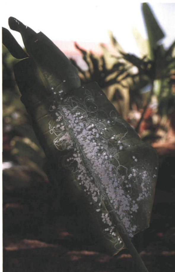
Fig. 6.—Abundantes puestas, larvas y adultos de Aleurodicus sobre una hoja de Musaceae .

Cuando las poblaciones son muy abundantes, la hoja se cubre de una masa algodonosa muy blanca que se extiende a lo largo de la superficie foliar, impidiendo por tanto la transpiración de la planta, con la consiguiente pérdida de clorofila que se manifiesta