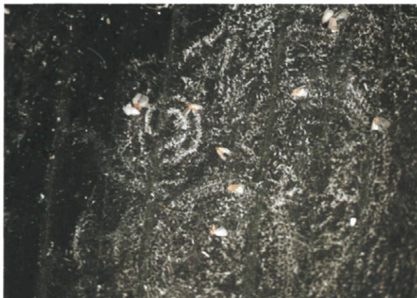
Fig. 4.—Adultos de Aleurodicus , muertos después de un control químico y puestas que habían realizado.

envés o sobre los frutos. Puede convivir con la «mosca blanca de los cítricos» (no hay confusión posible, pues esta última es de menor tamaño, con menos producción cérica y con puestas de huevos en forma circular muy evidente). Tiene 4 generaciones anuales y no se le conoce, hasta ahora ningún