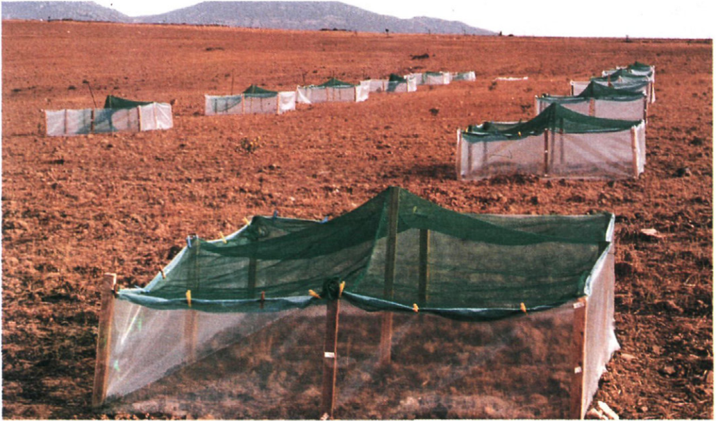
Fig. 2.—Jaulones para el ensayo de ninfas «La Gama» (Cabeza del Buey).

y los del segundo ninfas (L4 + L5) de langosta.