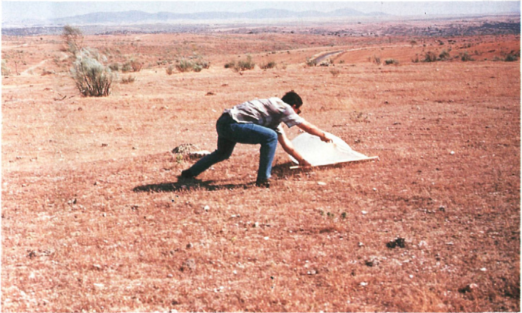
Fig. 1.—Manga para capturar langostas.

Las ninfas fueron capturadas mediante unas mangas diseñadas para la ocasión (Fig. 1). En cada parcela elemental se introdujeron 100 individuos, lo que llevó a la captura de 3.200 ninfas para cada uno de los 2 ensayos.