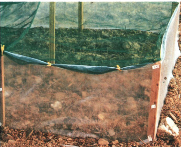
Fig. 3.—Detalles de la construcción de los jaulones

El diseño experimental fue de bloques al azar con 8 repeticiones en el caso de las ninfas y 7 en el de las larvas, por lo que el número de parcelas elementales fue de 48 en el primer caso y de 42 en el segundo.