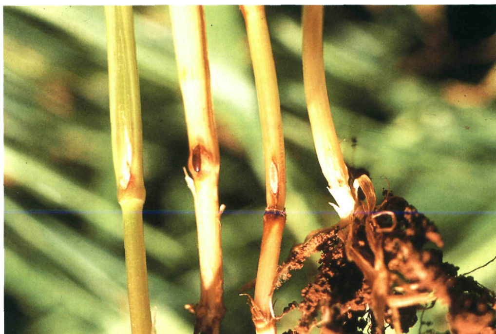
Fig. 3.—Tallos de trigo con larvas y pupario de «mosquito».