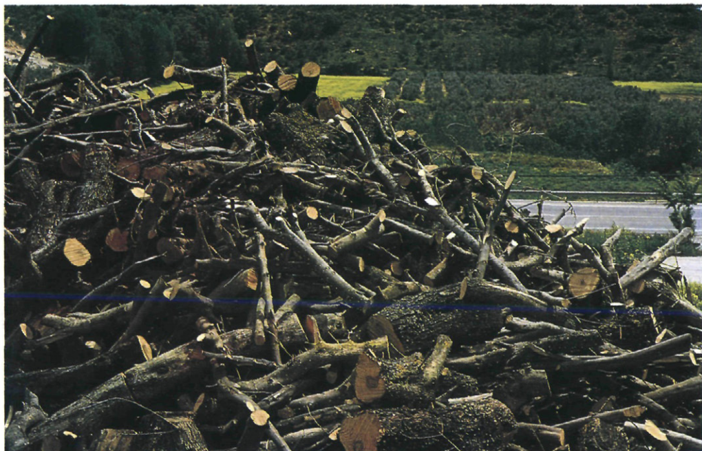
Fig. 1.—Leñas de poda del olivar almacenadas al aire libre.

cia de leñas infestadas en casas, cortijos, núcleos rurales... etc., han provocado durante los últimos años la utilización de la lucha química sobre los árboles afectados (CORTES y RODRIGUEZ, 1978).