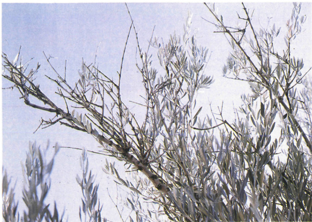
Fig. 4.—Daños causados por P. scarabaeoides en olivo con gran densidad de población. (Parte alta del sector Norte).

determinada por la existencia de vientos dominantes, en cuya dirección se puede propagar el insecto a lo largo de varios km. (GONZALEZ, 1989). Así pues, este es el tipo de olivar idóneo para obtener el material de cría, para lo cual debemos tener en cuenta que los árboles más indicados son los situados en la banda de distribución.