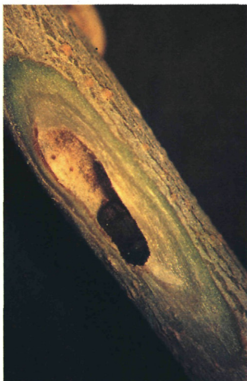
Fig. 2.— P. scarabaeoides en el interior de la galería de alimentación..

El objetivo de nuestro trabajo es la puesta a punto de la cría de P. scarabaeoides bajo condiciones controladas de laboratorio.