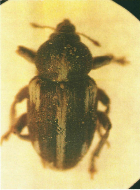
Fig. 2.—Vista dorsal de un adulto de Tychius quinquepunctatus L.