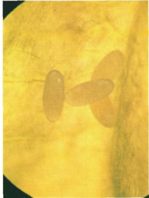
Fig. 5.—Puesta en el interior de una vaina.