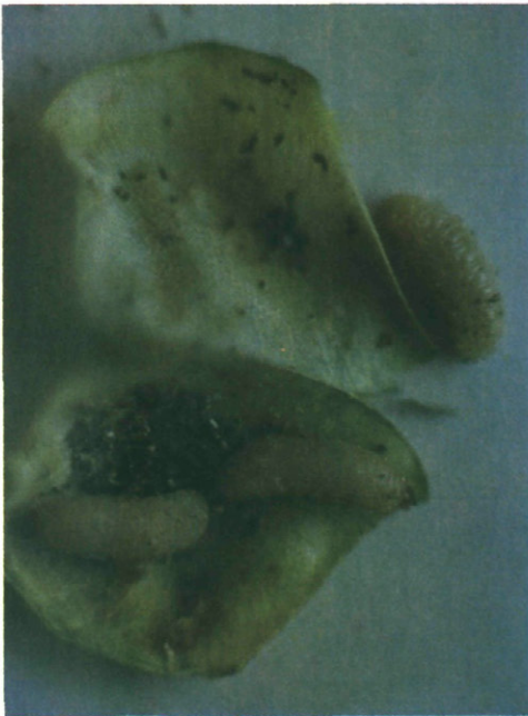
Fig. 4.—Larvas dentro de una vaina, después de haber devorado los granos.