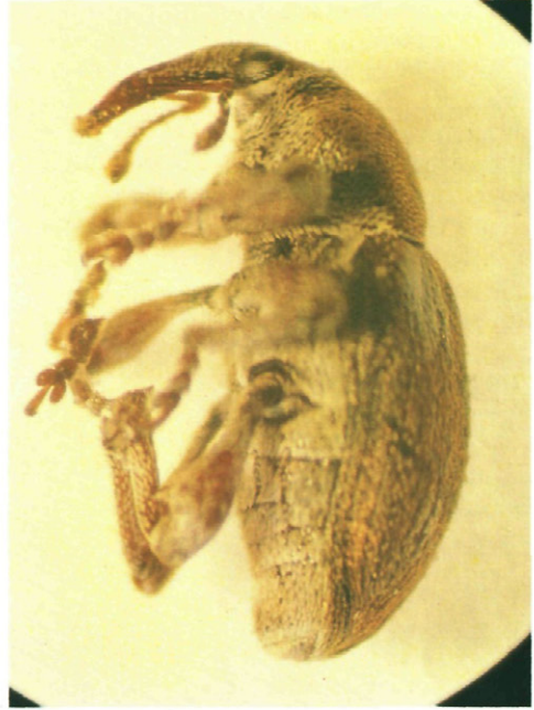
Fig. 3.—Vista lateral de un adulto de Tychius quinquepunctatus L.