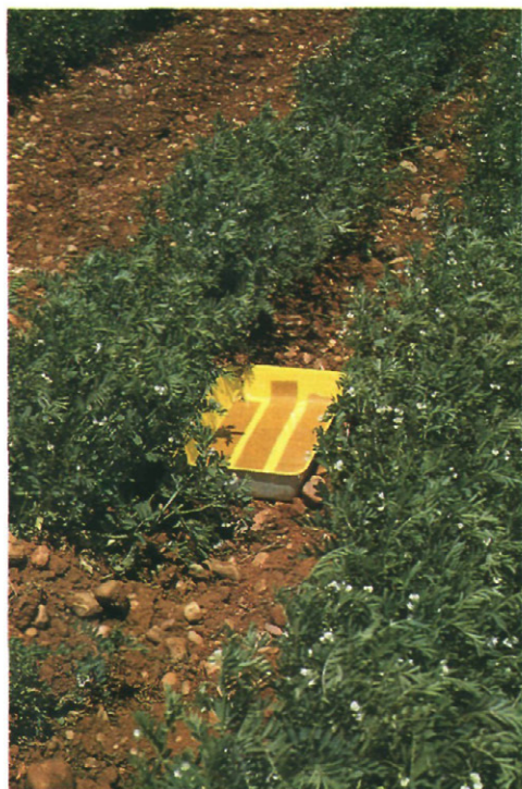
Fig. 1.—Colocación de las trampas en la parcelas.

tro bandejas de plástico de color amarillo o blanco al azar (Fig. 1), preparadas con cintas adhesivas "atrapa-insectos" en el fondo, con el fin de que los insectos que cayesen en la bandeja quedaran retenidos.