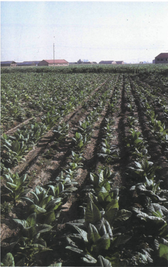
Fig. 1.—«Rodiales» en hileras de tabaco con mal crecimiento debidos a M. incognita .

Entre los factores abióticos, los suelos arenosos y los climas cálidos favorecen las poblaciones de los nematodos de los nódulos radiculares (CHRISTIE, 1959). Estas circunstancias se dan en la Vega de Granada, con la existencia de suelos arenosos-limosos y las altas temperaturas durante el período de crecimiento del tabaco.