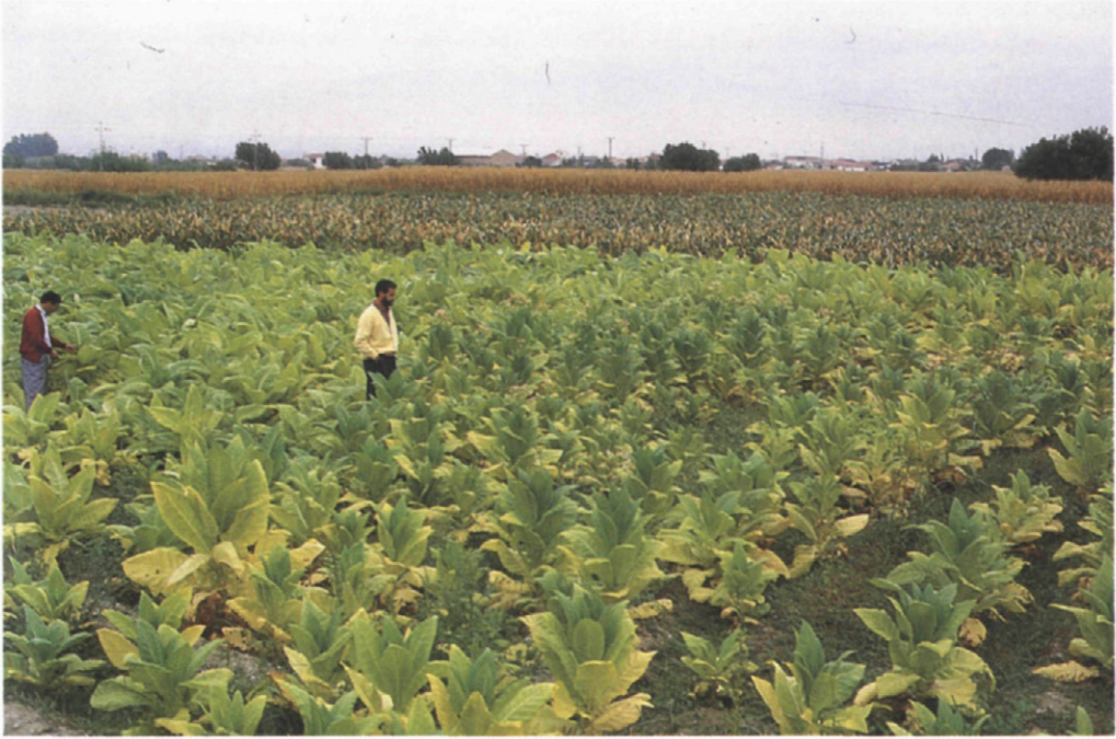
Figs. 7 y 8.—Cultivos de tabaco muy afectados por ataques de M. incognita .