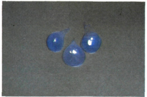
Fig. 3.—Hembras de M. incognita vistas al microscopio estereoscópico ( \times 32 ) (teñidas).