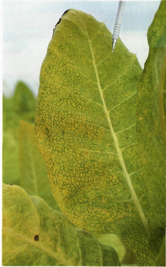
Fig. 2.—Síntomas de virosis en cultivos de tabaco en la Vega de Granada.

En la zona alejada , que engloba los Términos Municipales de Fuente Vaqueros y Pinos Puente, se mantiene al parecer más sana. El nematodo se ha encontrado infectando el 28 por ciento de los campos de esta zona, alcanzando niveles medios de infección de 174 larvas por 3 g. de raíces y máximos de 1.179. Los errores en este caso