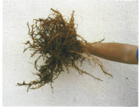
Fig. 5.—Raíces de tabaco con nódulos.

siquiera se recolectó el cultivo, que se dejó secar y pudrir en las mismas parcelas.