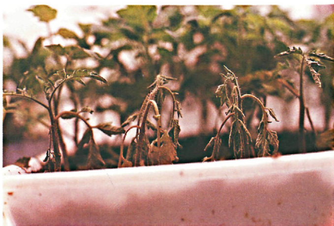
Fig. 2. — Epinastia producida por F. oxysporum f.sp. lycopersici (raza 0/raza 1) sobre la variedad Marmande. Inoculación en condiciones controladas.