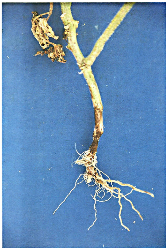
Fig. 3.—Daños producidos por la salinización del suelo en la variedad de tomate Carmelo (GC-204). Obsérvese la lesión de la base del tallo.