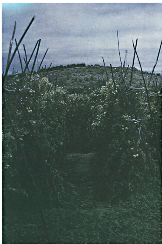
Fig. 4.—Efecto de la redistribución de las sales después de las lluvias. Nótese el amarilleamiento de las hojas terminales.