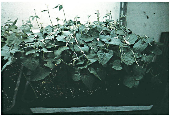
Fig. 2.—Cría en laboratorio de Tetranychus urticae sobre plantas de judía cultivadas en bandejas.

En el caso de P. citri las microjaulas de ensayos, basadas en la de TASHIRO (1967), constaban de una hoja de limonero sobre la que se montaba una estructura de plexiglas, manteniéndose la humedad de la hoja con un material absorbente humedecido debajo de la hoja y cerrándose por arriba con una lámina de pa-