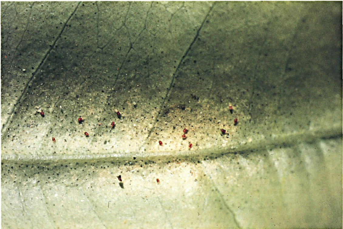
Fig. 1.—Colonia de araña roja Tetranychus urticae en el envés de una hoja de clementino.

Este proceso de desarrollo de resistencia a acaricidas se ha observado a menudo en los cítricos cultivados en otros países, especialmente en el caso de P. citri . Sin embargo, la velocidad de desarrollo de resistencia parece depender en gran parte del plaguicida utilizado y así es muy rápida en los casos de fosforados y carbamatos (JEPPSON et al., 1975). También son frecuentes resistencias a acaricidas específicas, como es el caso de tetradifón y dicofol, y JEPPSON (1977) considera que el desarrollo de resistencias es más rápido en el caso del tetradifón, bastando sólo de 3 a 4 aplicaciones. Esta observación parece confirmarse observando los acaricidas específicos recomendados en la actualidad para combatir tetraníquidos en cítricos: mientras en países donde la plaga es reciente o poco importante se recomienda la mezcla de tetradifón y dicofol, caso del con-