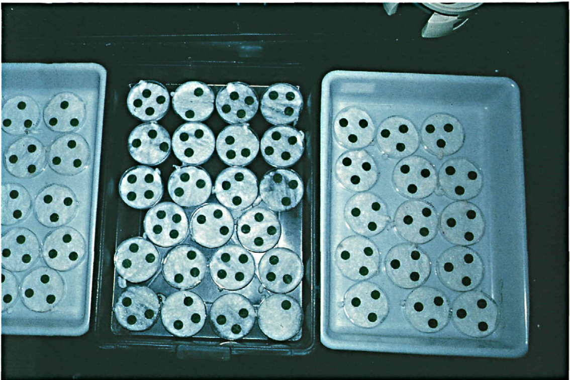
Fig. 4.—Vista general de una de las experiencias con discos de hoja de judía.

aplicado sobre huevos de P. citri produce mucha mayor mortalidad en las larvas resultantes de esos huevos tratados que sobre los mismos huevos que han sido pulverizados con el plaguicida.