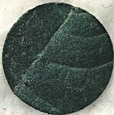
Fig. 3.—El efecto de los acaricidas sobre Tetranychus urticae se ensayó en discos de hoja de 2 cm. de diámetro colocados sobre algodón húmedo.

rafilm con microperforaciones. En cada una de las microjaulas se colocaron 5 hembras en los ensayos de acción adulticida, y de 5 a 15 huevos en los de acción ovicida. Dichos huevos se obtenían de la puesta de 3 hembras depositadas en la microjaula tres días antes del inicio del ensayo y que se retiraban entonces. Para la acción adulticida se ensayaron 30 hembras por dosis, y se midió la supervivencia y fecundidad de las hembras los días 1.º, 4.º, 6.º y 9.º después del tratamiento. En la acción ovicida se ensayaron de 50 a 100 huevos por dosis, y se observaba el número de huevos eclosionados y el número de larvas que alcanzaban el estado de ninfa.