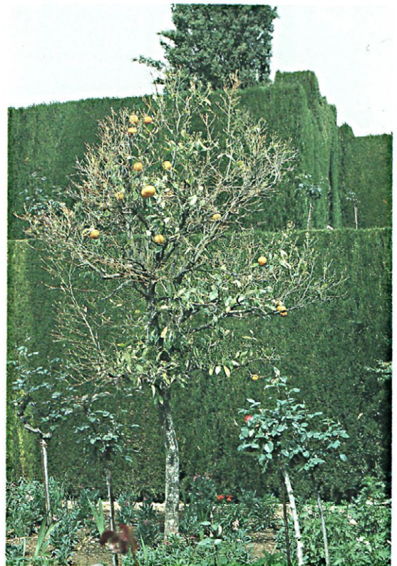
Fig. 1.—Naranjos atacados por Tylenchulus semipenetrans (Alhambra y Generalife)