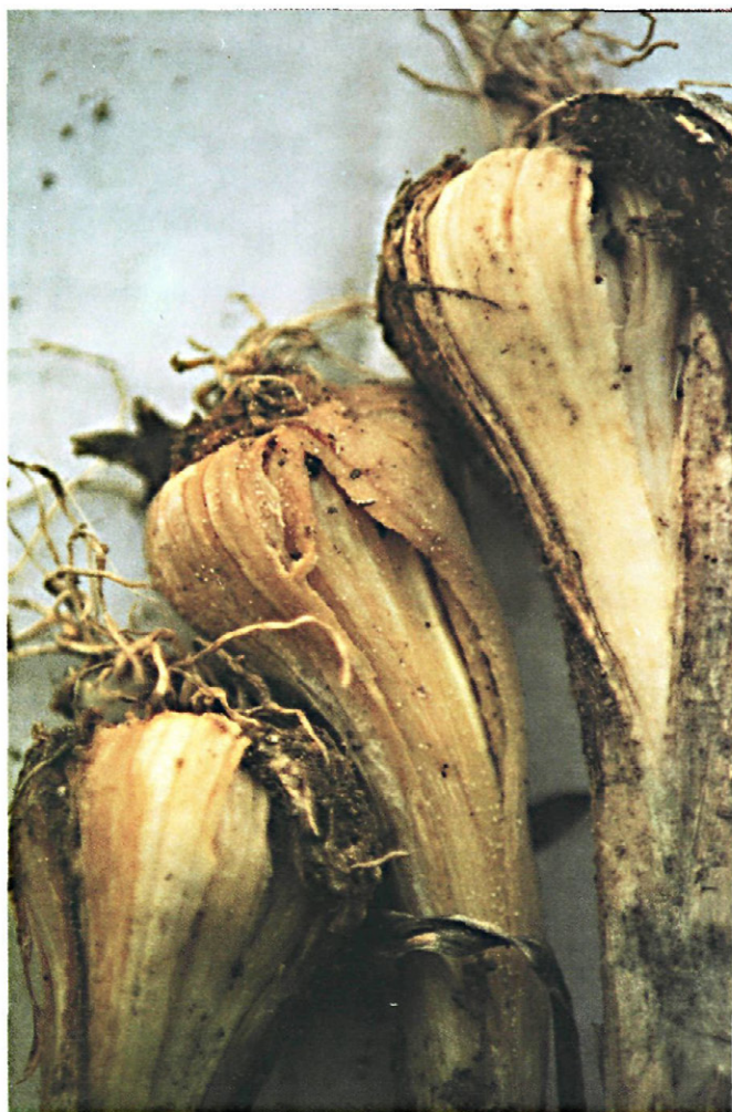
Fig. 1.—Ajos afectados por nematodos ( D. dipsaci ), Sclerotinia y Penicillium .

da granulado Fenamifos y dientes de ajo sin fungicida.