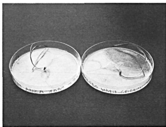
Fig. 2.—Cultivo artificial en agar.

El cultivo en medio artificial (fig. 2) se ha llevado a cabo del modo siguiente: en placa