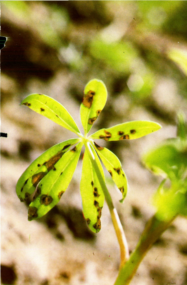
Fig. 2.—Ataque de Pleiochaeta setosa en altramuces.