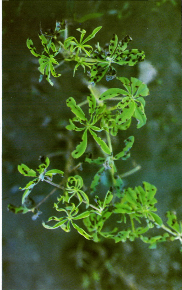
Fig. 3.— Pleiochaeta setosa sobre Lupinus .