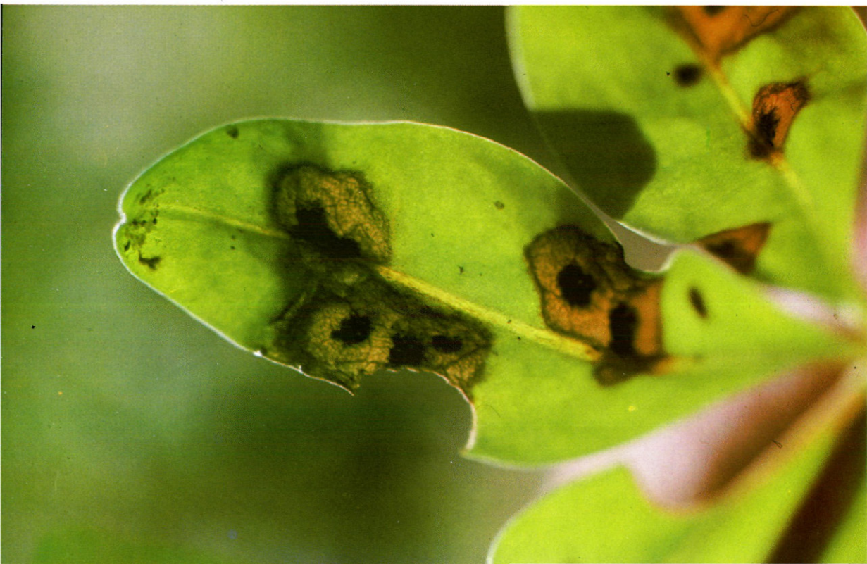
Fig. 1.—Hoja de altramuz atacada por Pleiochaeta setosa .

De la bibliografía consultada parece que este patógeno no ha sido citado anteriormente en España ni en ningún otro país del área mediterránea. No ocurre lo mismo en Florida (EE.UU.) donde se considera la enfermedad más grave que soportan los lupinus azul ( L. angustifolius L.) y amarillo ( L. luteus L.) (OSTAZESKI, 1958). También está citado este patógeno en Sud-Africa (DUPLESISS, 1953), Australia (GLADSTONES, 1970), Canadá (HUGHES y otros, 1974), y Rusia (ZOLATAREV, 1975).