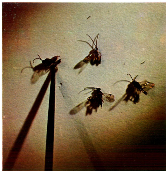
Fig. 8.—Imagos de Microgaster tiro Reihn.