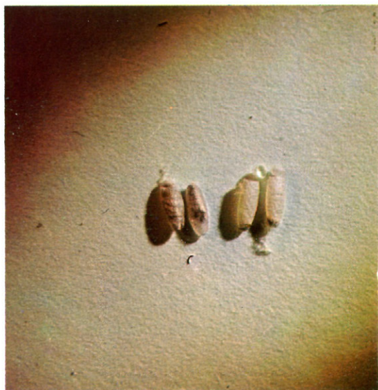
Fig. 7.—Capullos de pupación de Microgaster tiro Reihn.