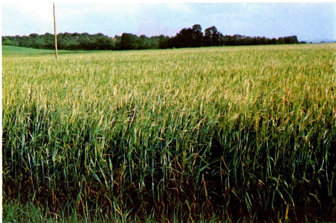
Fig. 6.—Campo fuertemente atacado, obsérvese la coloración pajiza del extremo de las plantas, cuando deberían estar aún verdes.