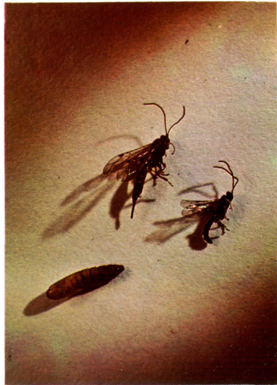
Fig. 5.—Macho y hembra de Itoplectis maculator F.