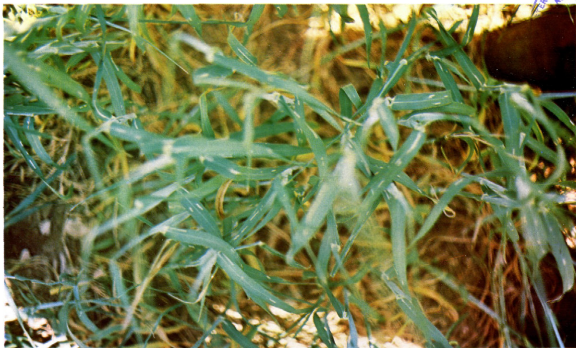
Fig. 1.—Aspecto de un cultivo muy atacado; se ven numerosas minas como rayas blancas en las hojas.

5.º Calcidido .—Hemos encontrado de forma esporádica otro heminóptero parásito de crisálidas, que aún no hemos identificado. Cada crisálida proporciona de 4 a 12 adultos.