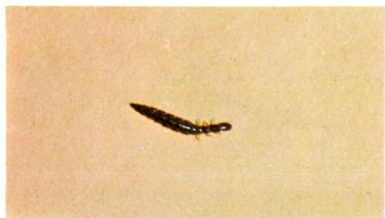
Fig. 9.—Predador frecuentemente encontrado en la corteza de los pinos.