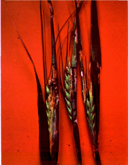
Fig. 4.—Espigas parcialmente destruidas; en una de ellas se observa un capullo de pupación del parásito Microgaster tiro Reihn.