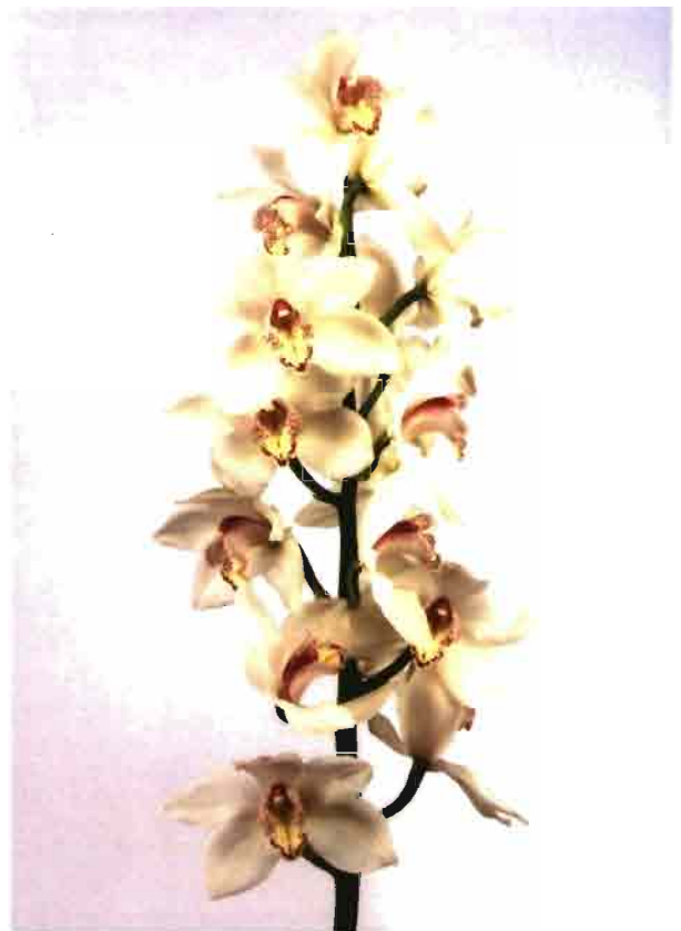
Existen multitud de variedades de las populares orquídeas.

■ El sector de ornamentales norteamericano incluye la flor cortada y los productos de vivero - planta en maceta, de temporada y de jardín, incluyendo árboles y arbustos