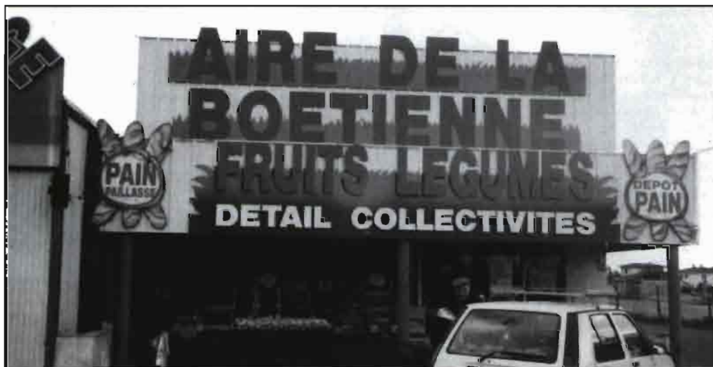
En este comercio francés especializado en la venta de frutas y hortalizas de Agen (Francia) estaban interesados en saber si habían colocado debidamente los nombres de los tipos y la procedencia de las hortalizas de España.

El fuerte componente local de la exposición SIFEL que se organiza en Agen, ayuda a definir cuáles son