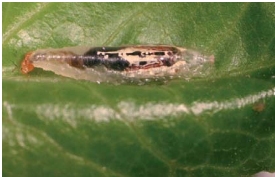
Foto 2. Larva de sítido depredando un pulgón de la lechuga ( N. ribisnigri ).